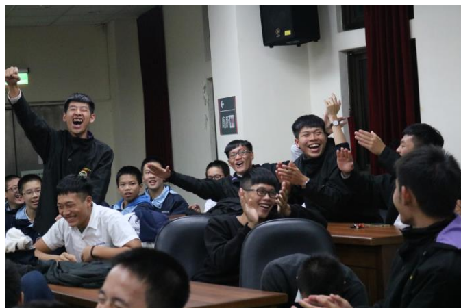
遊戲過程中互動熱烈歡樂