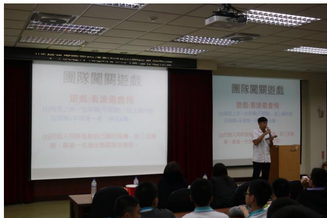
體育班學生互動遊戲增進情感交流

主題： 106 學年度體育班運動訓練與管理 專題報告 時間： 106 年 11 月 24 日 地點： 成淵高中綜合大樓 5F 研討室