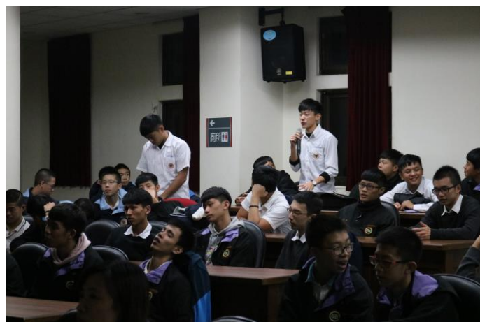
演講後學生踴躍發問