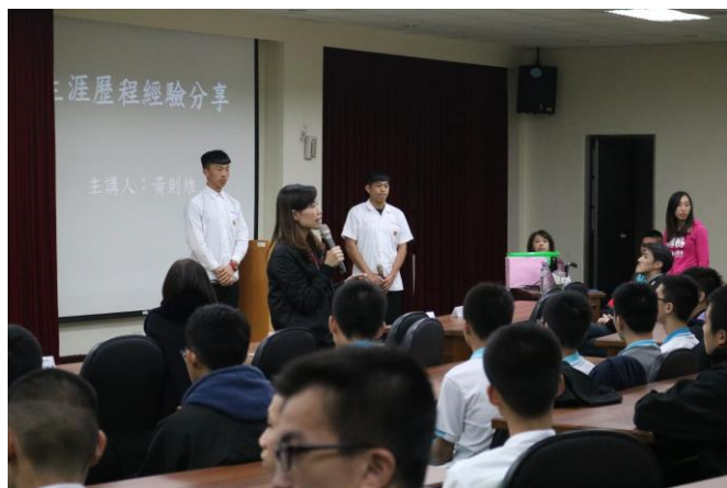
學務主任對體育班學生勉勵

主題： 106 學年度體育班運動訓練與管理 專題報告 時間： 106 年 11 月 24 日 地點： 成淵高中綜合大樓 5F 研討室