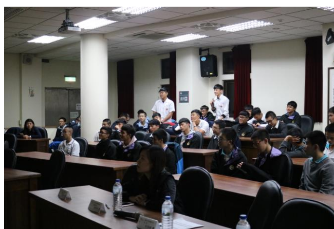
師長與學生專心聆聽