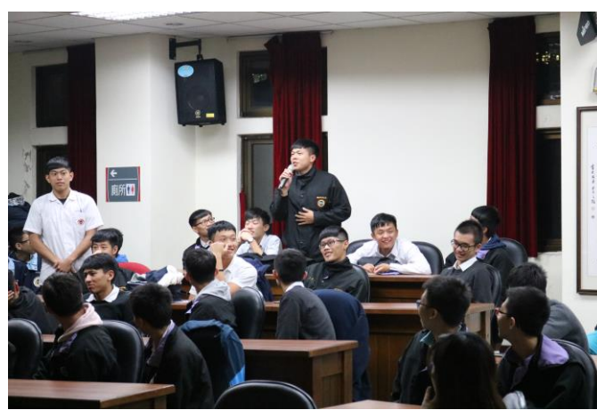
演講後學生與講師互動問答