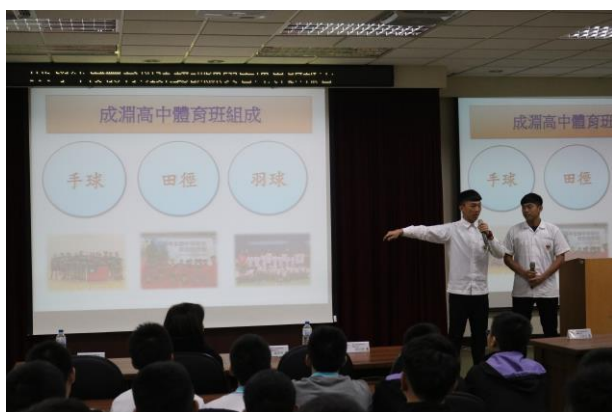
體育班近況介紹(學生主持)