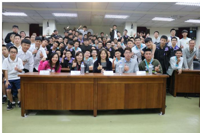
專題報告後全體師生大合照