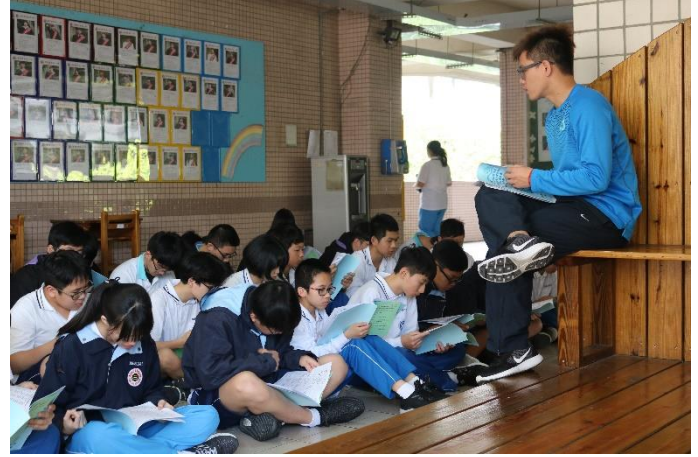
發放秩序冊及說明比賽相關事宜