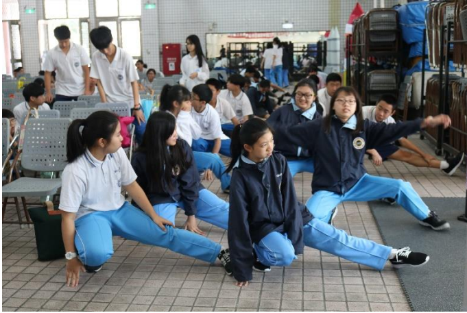
國中部-賽前暖身情形