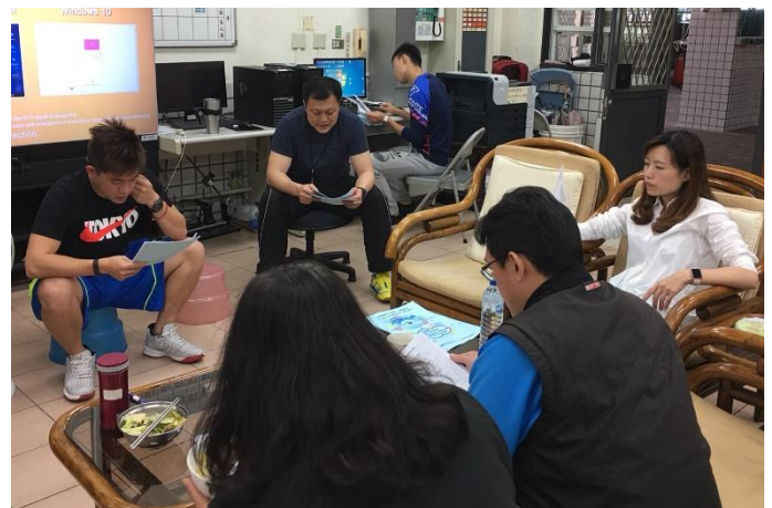
賽前體育老師工作分配及說明情形