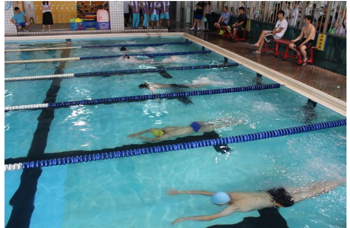
高中男生組-個人項目比賽情形