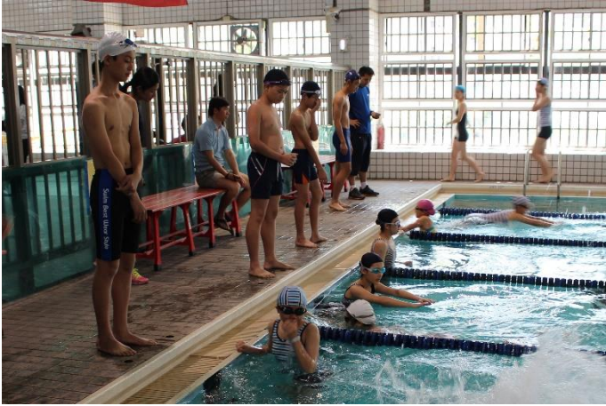
國中部-大隊接力比賽情形