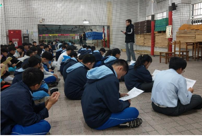
發放報名表及說明相關事宜