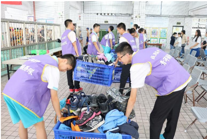
羽球隊學生協助幫忙情形