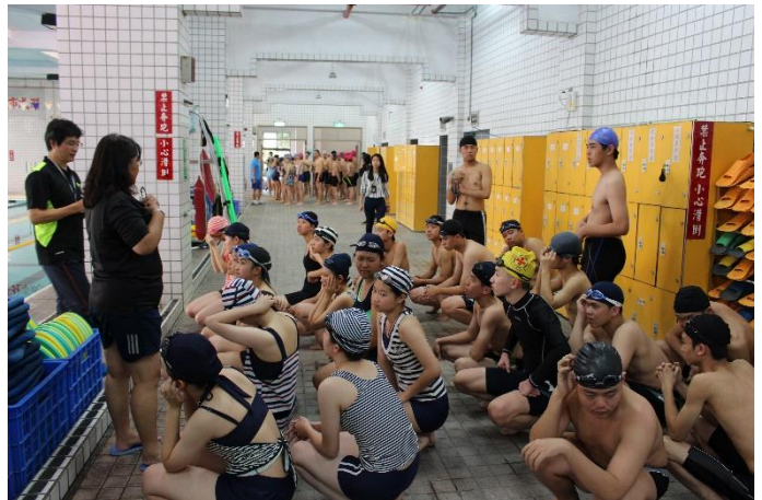
師長再次宣導注意事項