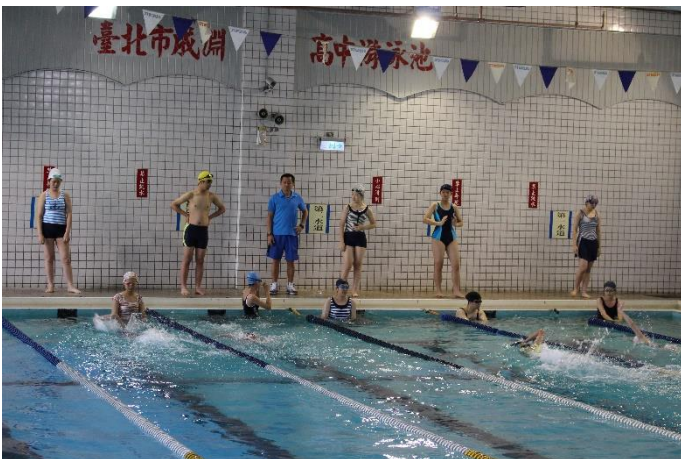
高中部-大隊接力比賽情形