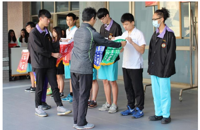
祈維主任頒發高中部大隊接力獲獎錦旗