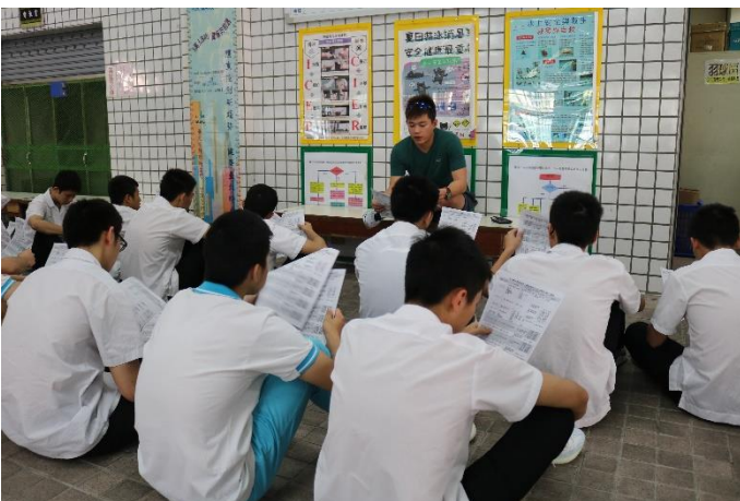
賽前羽球隊學生工作分配項目說明情形