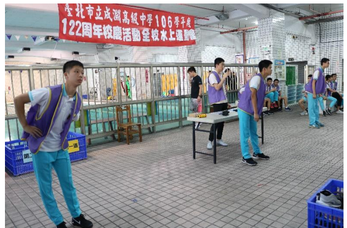
羽球隊協助帶領同學做暖身操