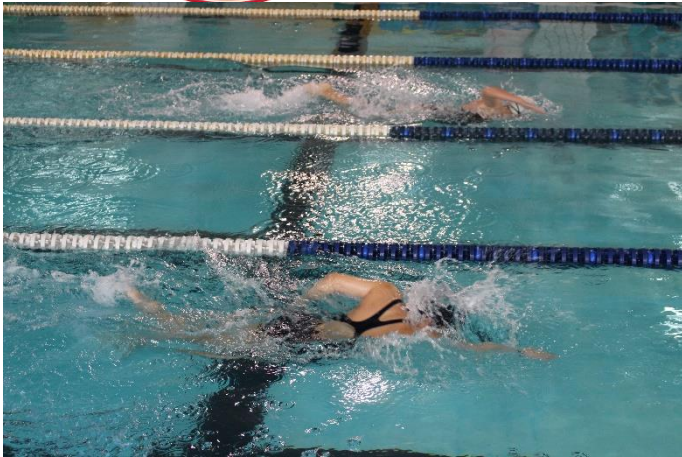
高中女生組-個人項目比賽情形