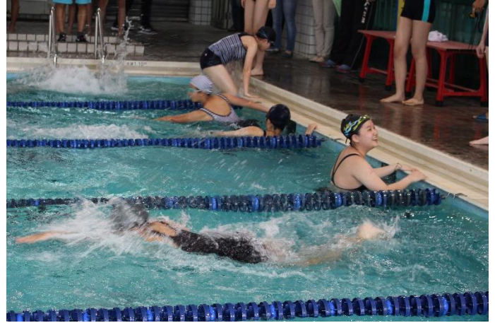
國中部-大隊接力比賽情形