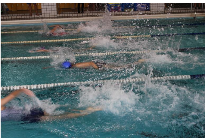
國中女生組-個人項目比賽情形