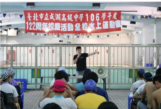
鼎元組長說明比賽相關注意事項