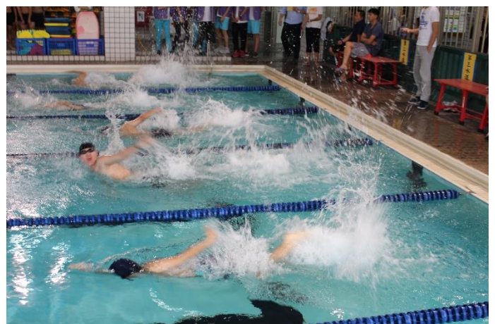
國中男生組-個人項目比賽情形