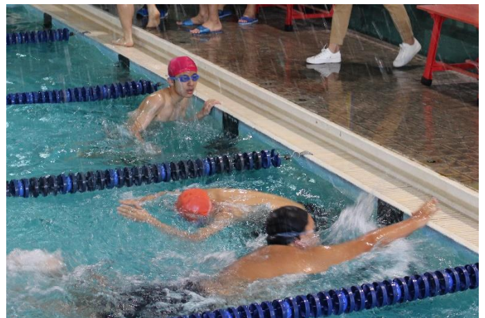
高中部-大隊接力比賽情形