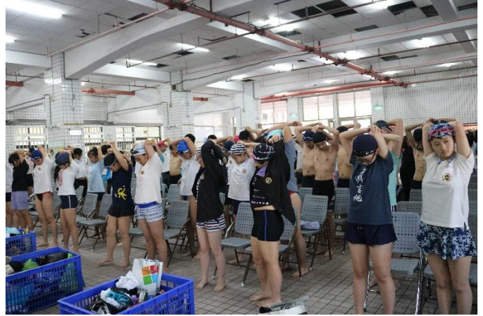
高中部-賽前暖身情形