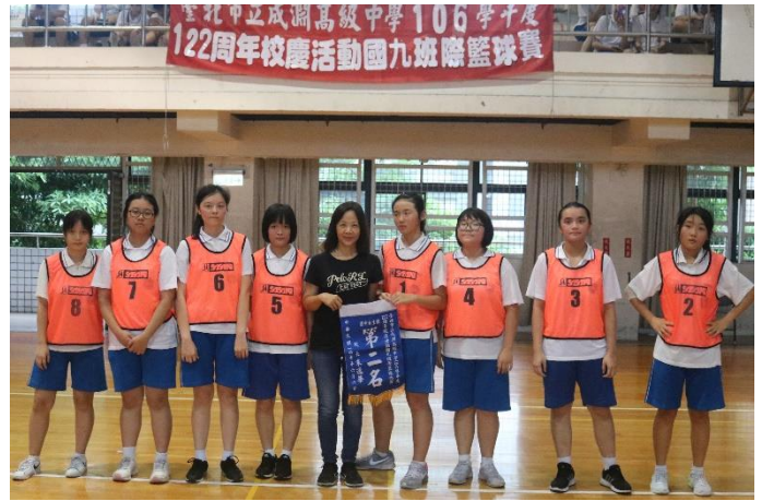
5 對 5 籃球賽女生組第二名：901