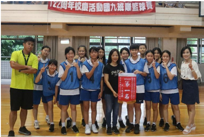
5 對 5 籃球賽女生組第一名：907