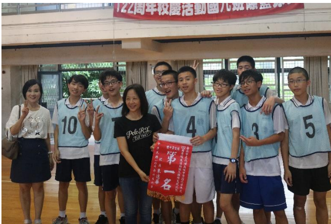
5 對 5 籃球賽男生組第一名：907