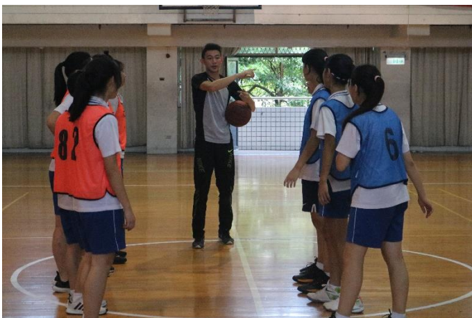
裁判簡易說明規則