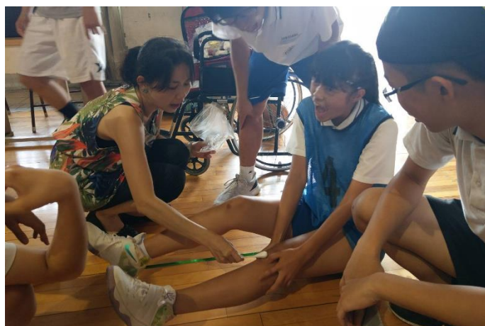
醫護人員為受傷選手治療情形