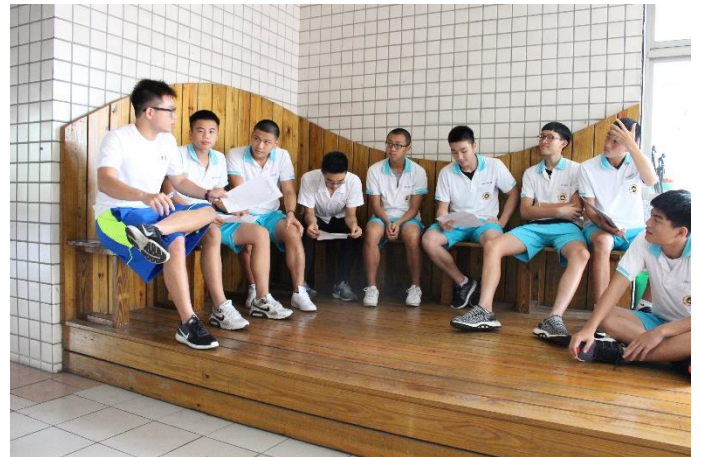
高一手球隊協助紀錄台及工作說明情形