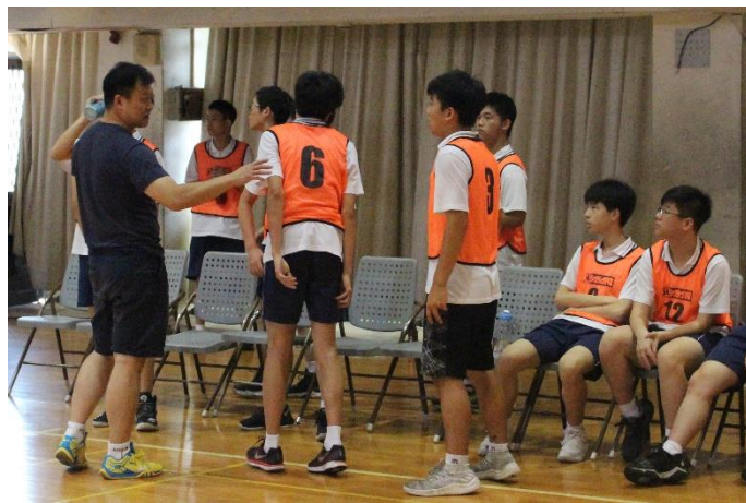
老師指導選手戰略情形