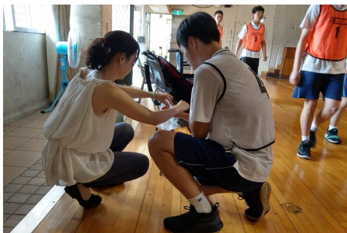
醫護人員為受傷選手治療情形