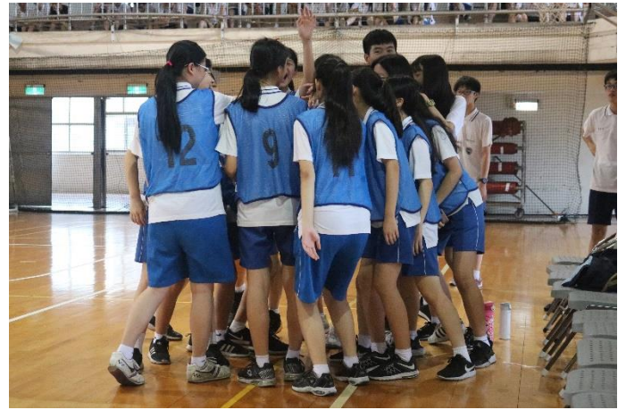
選手們比賽前團結加油打氣情形