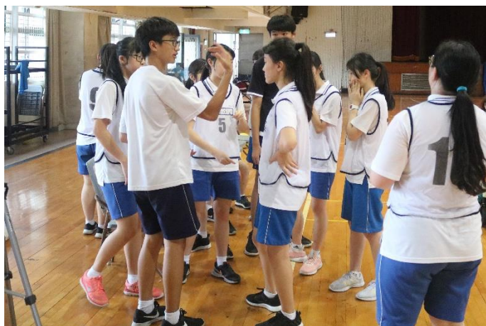
班級同學與選手討論戰略情形