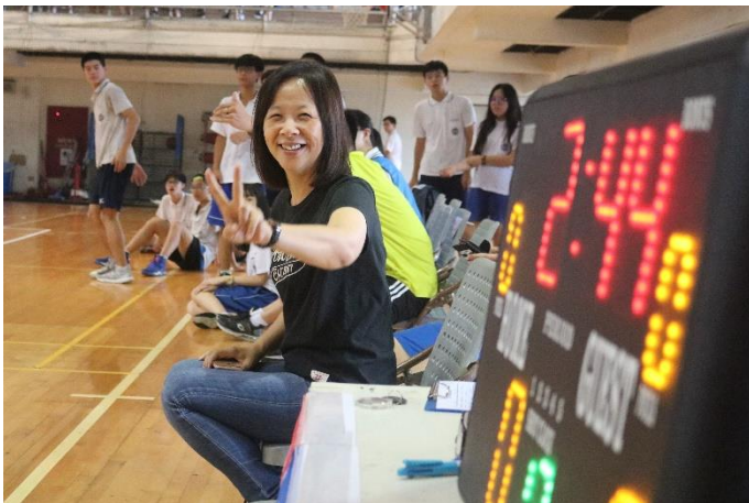
朱校長蒞臨現場為選手們加油打氣