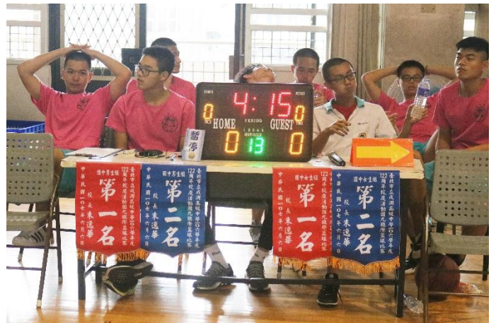
手球隊協助擔任紀錄台情形