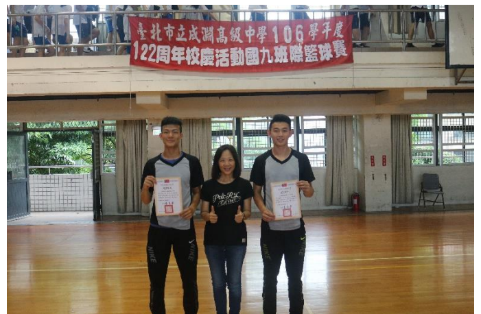
朱校長頒發感謝狀給裁判