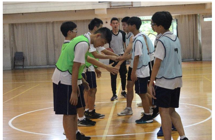
比賽前兩隊禮貌性的先禮後兵