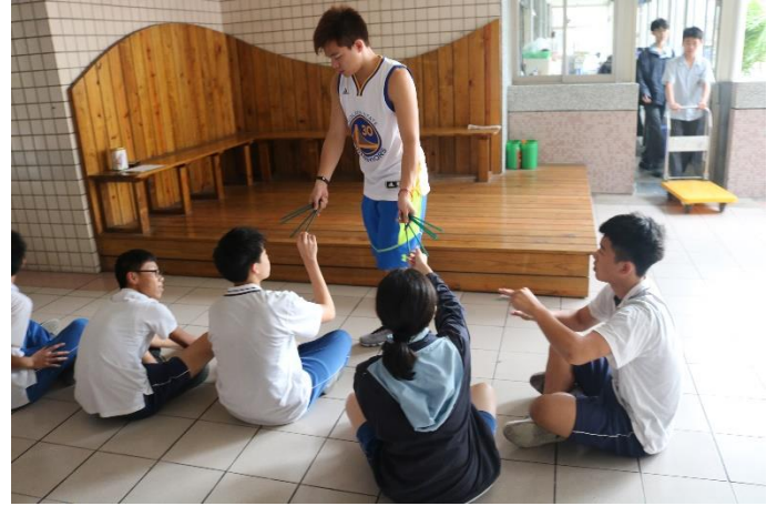
抽籤安排比賽順序情形