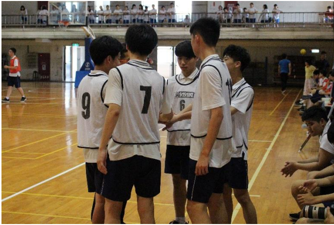
選手們比賽前團結加油打氣情形