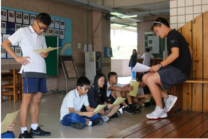
發放報名表及說明情形