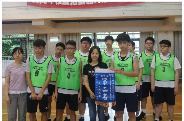
5 對 5 籃球賽男生組第二名：904