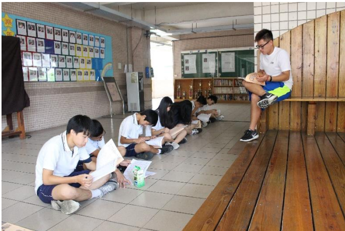
發放秩序冊及說明比賽注意事項