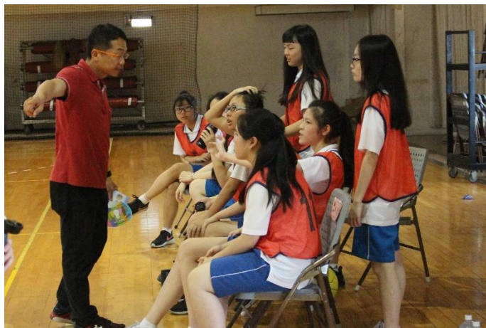
老師指導選手戰略情形