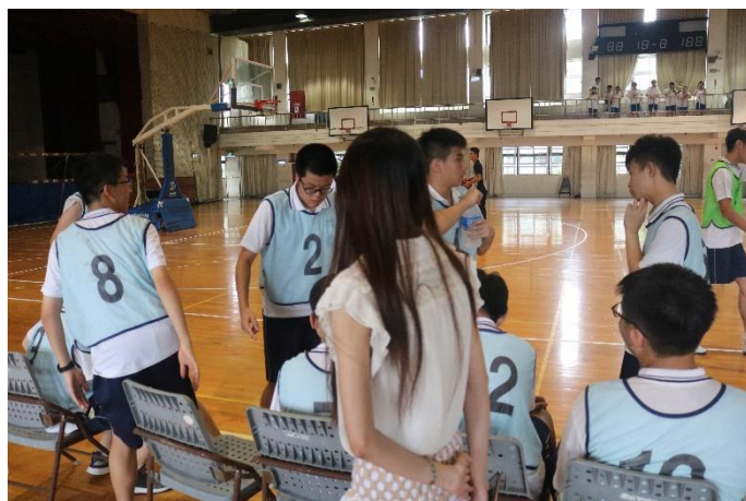
導師蒞臨現場為班級加油打氣