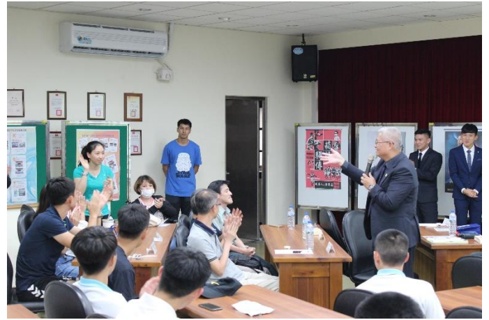
師長踴躍參與體育班成年禮