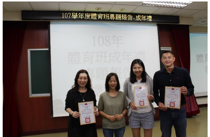
校長頒發評審感謝狀