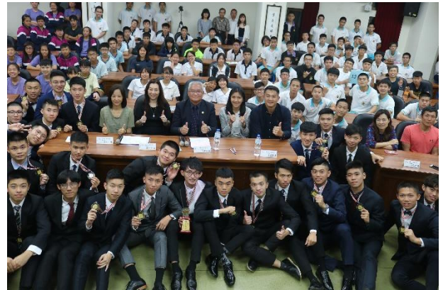
活動結束全體大合影