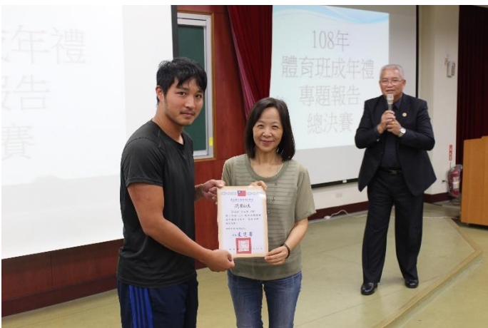
校長頒發友校參與感謝狀