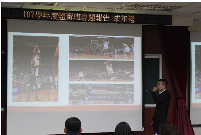
施智維-美國 NBA 籃球