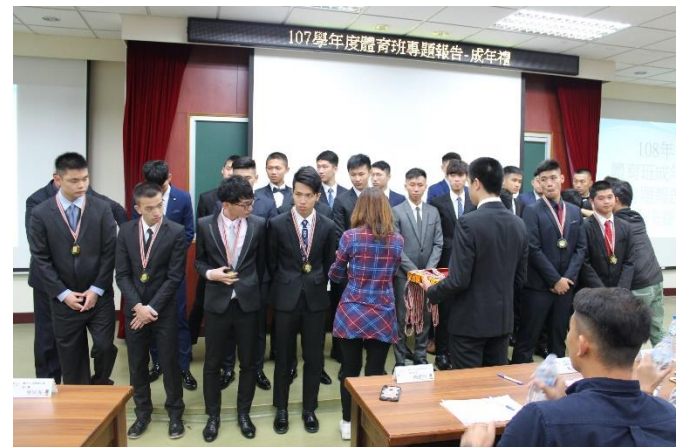
學務主任頒發獎牌