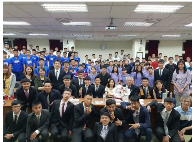
活動結束全體大合影