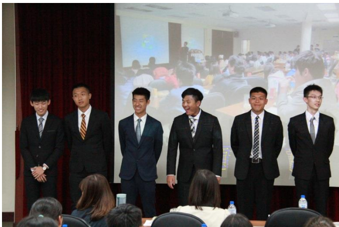
決賽學生等待頒獎