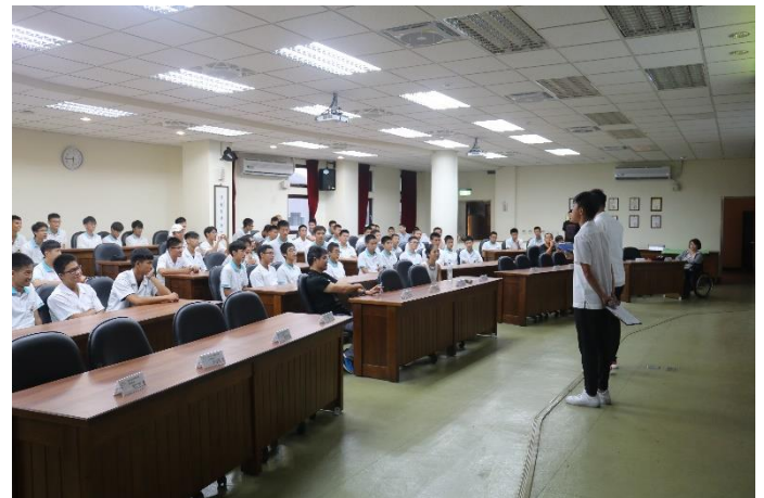
體育班迎新活動開始