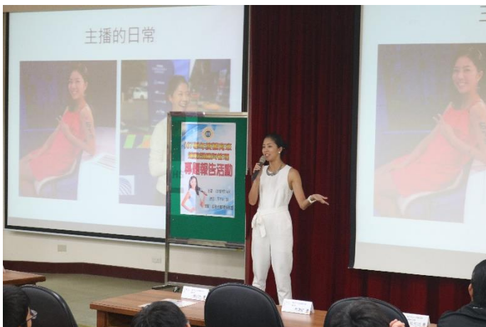
分享運動經歷及職涯發展