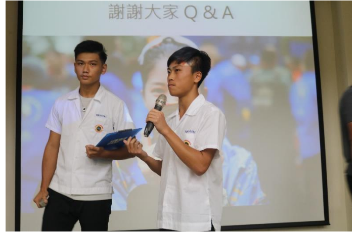
Q & A 時間踴躍