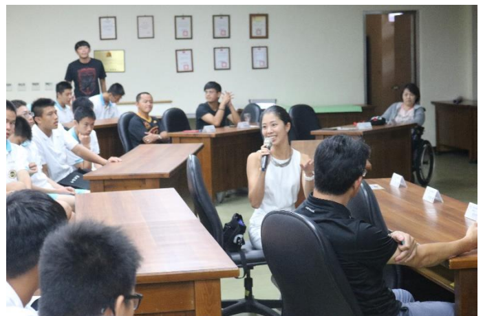
講師與學生互動熱烈