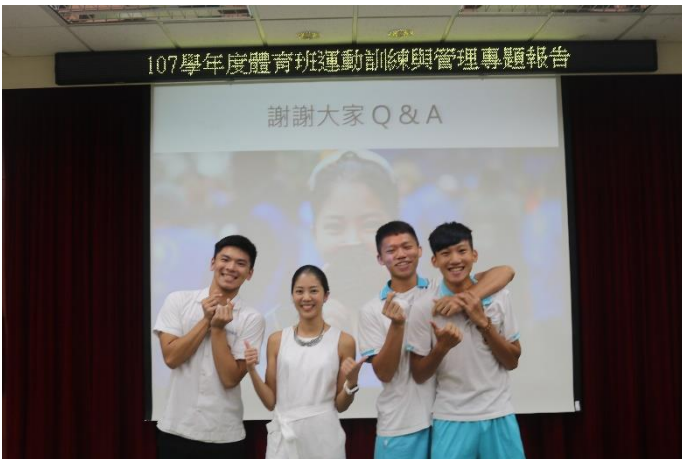
演講結束學生與講師合影