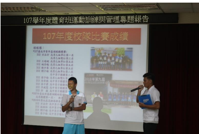
介紹體育班特色、紀律及代表隊競賽成績