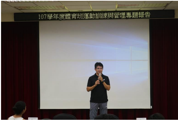
體育班專題報告-祈維主任致詞