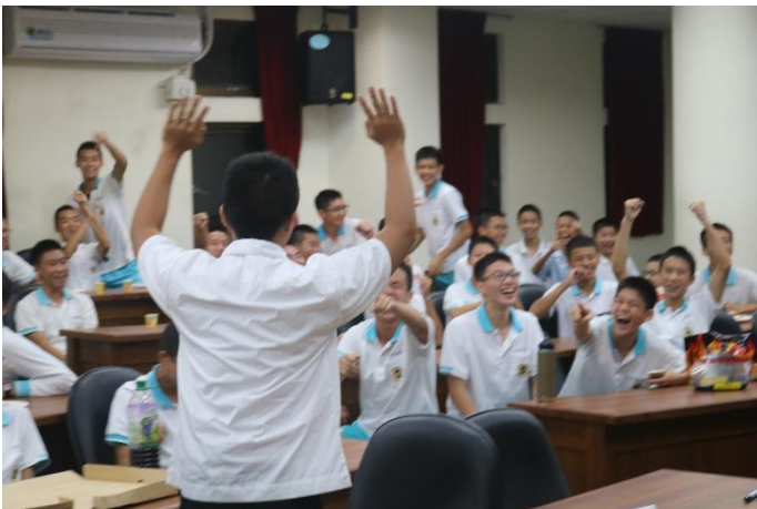
學生互動交流活動反應熱烈