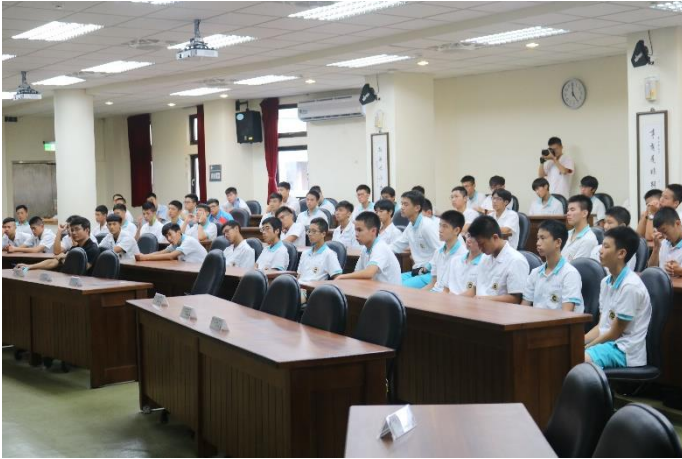
學生專心聆聽演講