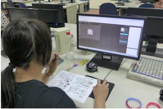
助教示範製作方式