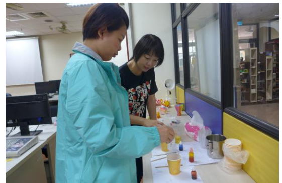
教師實際操作作品染色