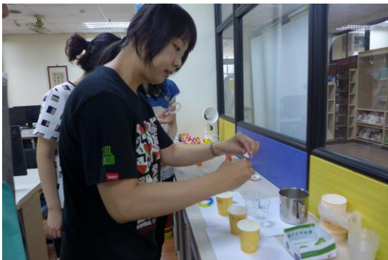
助教示範染色技巧