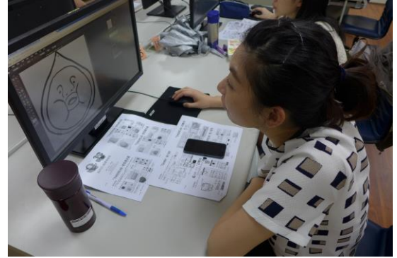
教師自行設計圖案