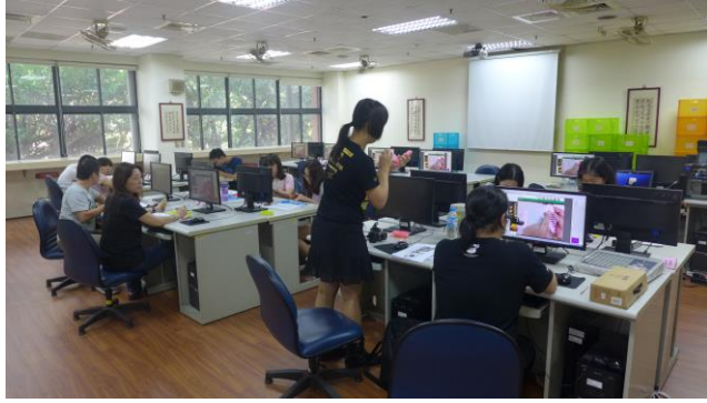
講師解說課程內容