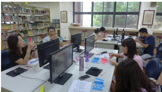
老師互相觀摩學習