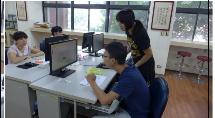
助教協助教師解決問題