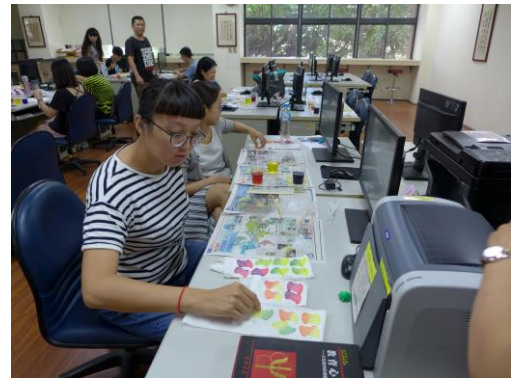
教師練習染色技巧