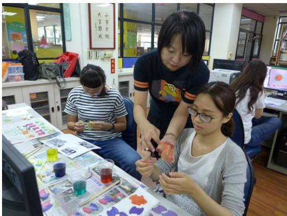
教師練習組裝成品