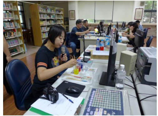
利用實務投影機教學