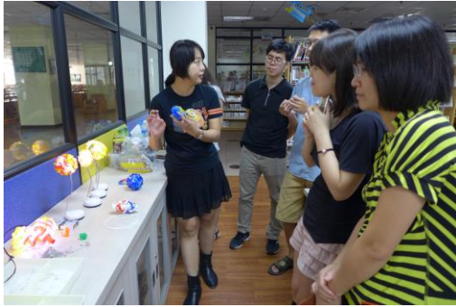
講師講解當天課程