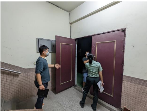
學務、總務、教官室場地現勘