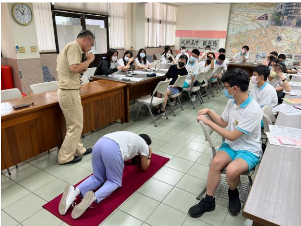
學生防空姿勢練習