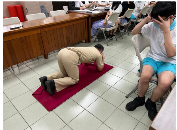
教官防空姿勢示範