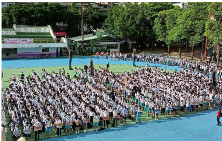
於操場集合清點人數