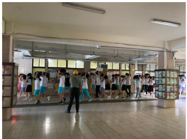
引導學生疏散至空曠地