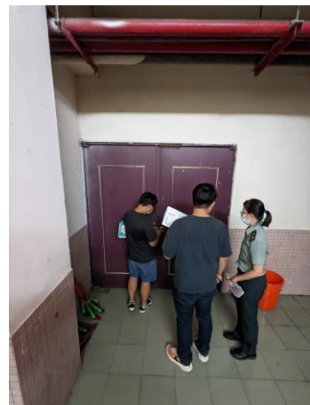
學務、總務、教官室場地現勘