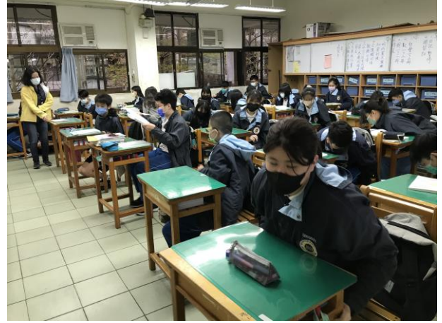
廣播提醒演練重點