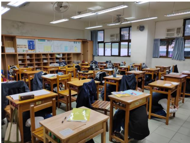
室內就地掩蔽及引導