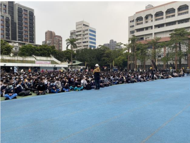
人員集合清點、檢查防災卡