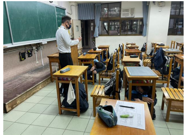
室內就地掩蔽及引導