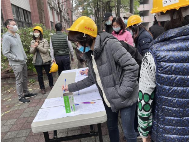
師長於操場集合清點