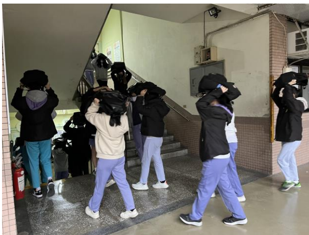
學生疏散往集合場