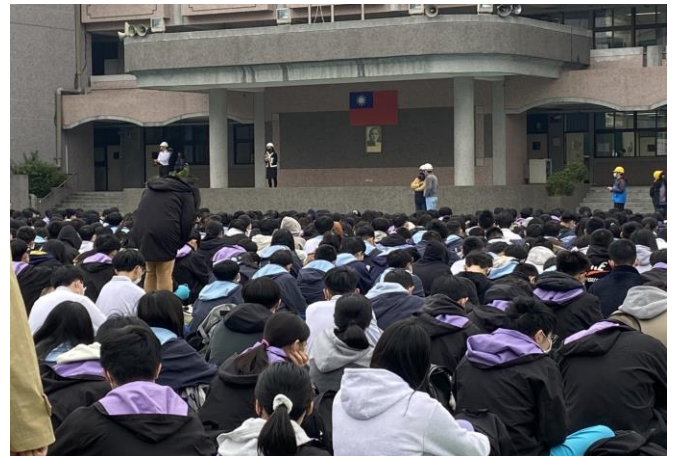
校長致詞並提醒演練重要性