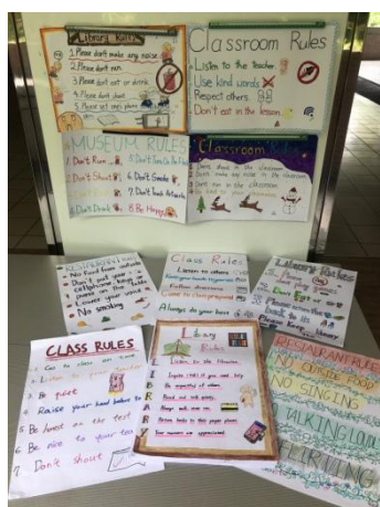
▲用英語看世界課程：學生自製英文標語海報