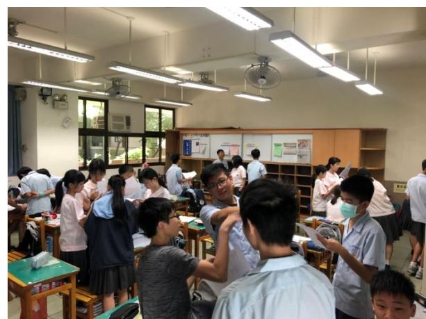
▲用英語看世界課程：學生分組討論自製海報標語內