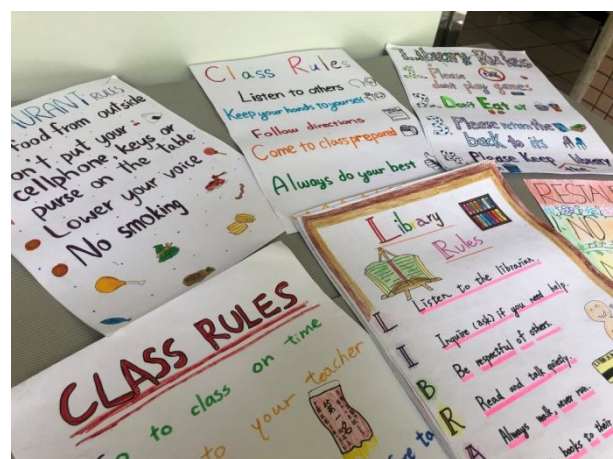
▲用英語看世界課程：各式英文規則海報