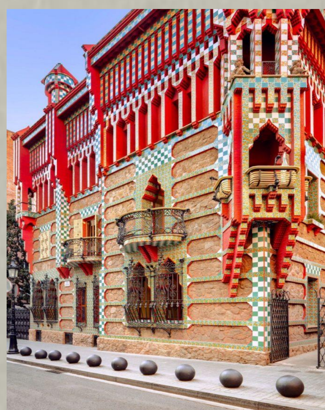
維森斯公寓 Casa Vicens

這是高第在色彩與構圖上登峰造極之作，其於1984年被聯合國教科文組織列為高第第一批世界文化遺產。位於巴塞隆納 El Carmel 山上