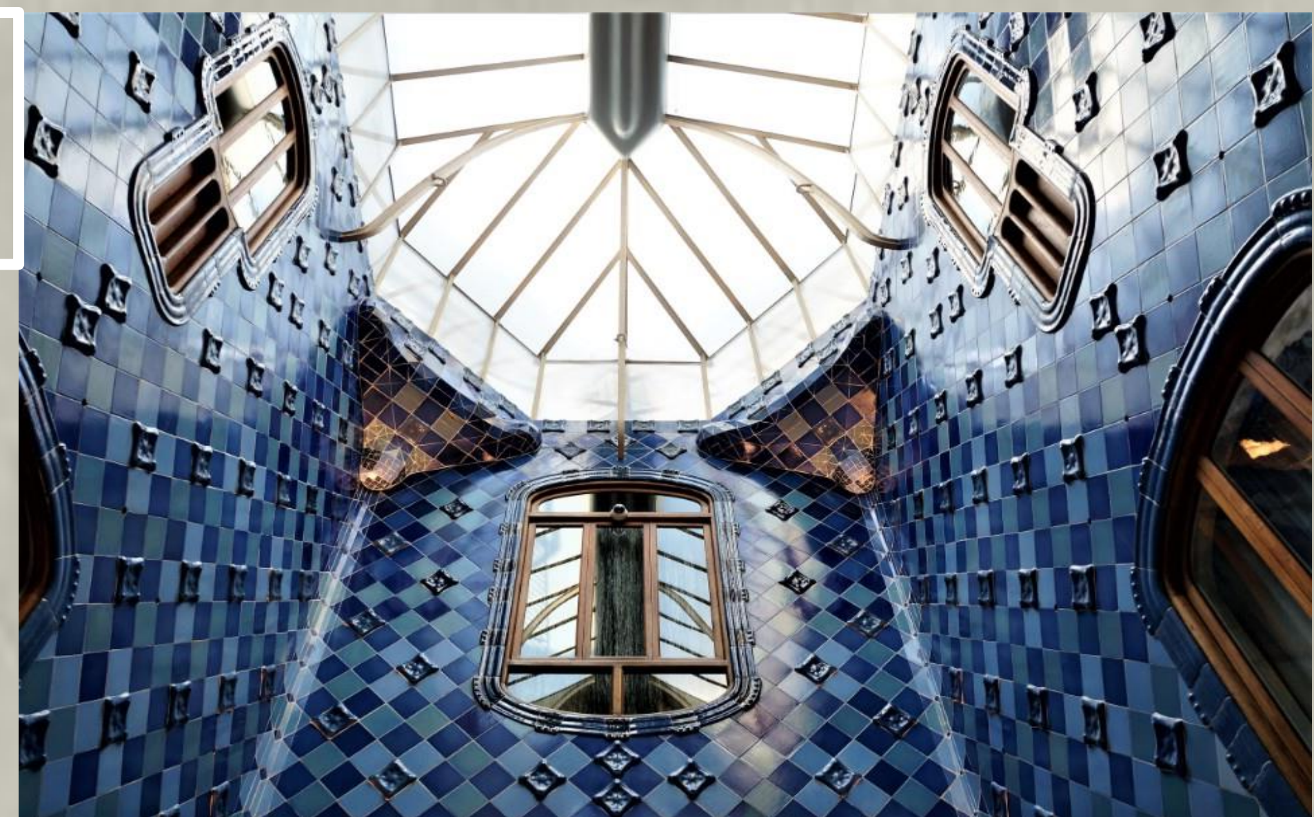
巴特婁之家 Casa Batlló

不和諧街區裡最知名(怪異)的建築必然還是高第的巴特婁之家，一隻巨龍盤旋在屋頂、牆面又好似一個個骷髏頭。高第運用碎彩磚拼貼而成的繽紛馬賽克，將自然與童話轉化為建築的視覺語言。