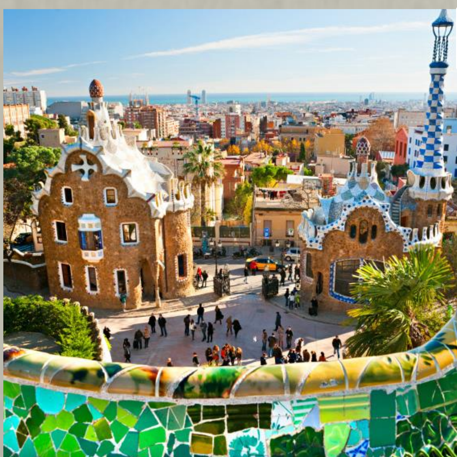
奎爾公園 Parque Güell

這是高第在色彩與構圖上登峰造極之作，其於1984年被聯合國教科文組織列為高第第一批世界文化遺產。位於巴塞隆納 El Carmel 山上