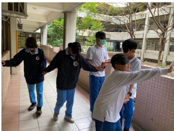
▲ 閱讀課程與寫作：讓同學們互相扶持，體驗盲胞在路上行走的感覺。