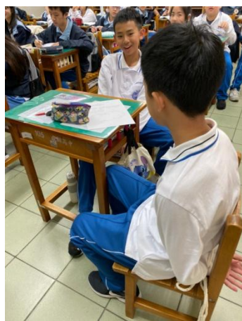
▲ 閱讀課程與寫作：心囚體驗，讓學生們體驗四肢不便的感覺。