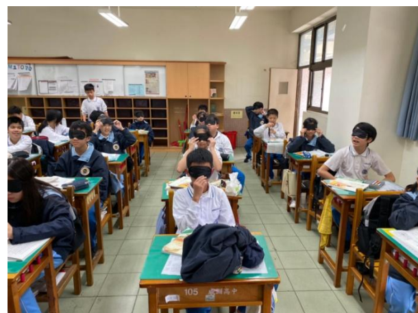
▲ 閱讀課程與寫作：學生們在教室先嘗試用眼罩體驗看不見的感覺。