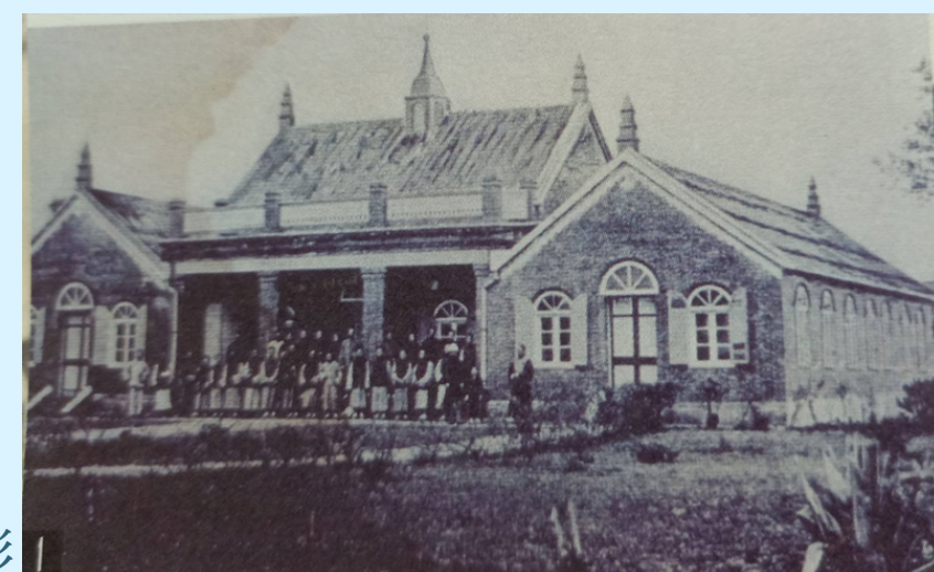
圖一：馬偕與牛津學堂學生合影

如今理學堂大書院被內政部評定為二級古蹟，亦是新北市市定古蹟，並位於真理大學之校區內。