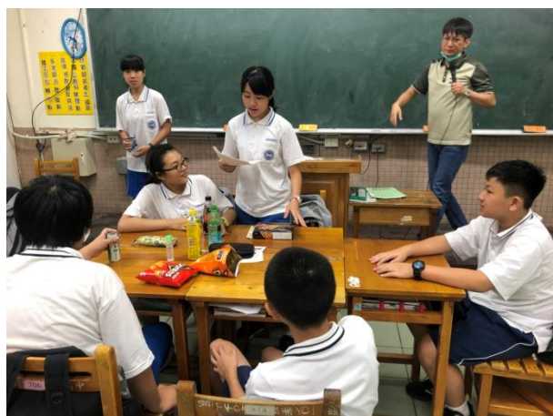
▲數學探究專題課程·教師提醒學生在介紹時應該注意的事項。