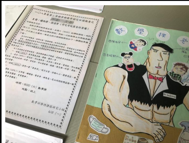
▲數學探究專題課程課前通知與學生自製課程活動表