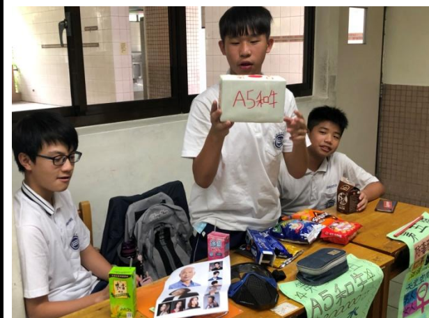
▲數學探究專題課程·學生於課堂介紹組內活動與擔任的角色。