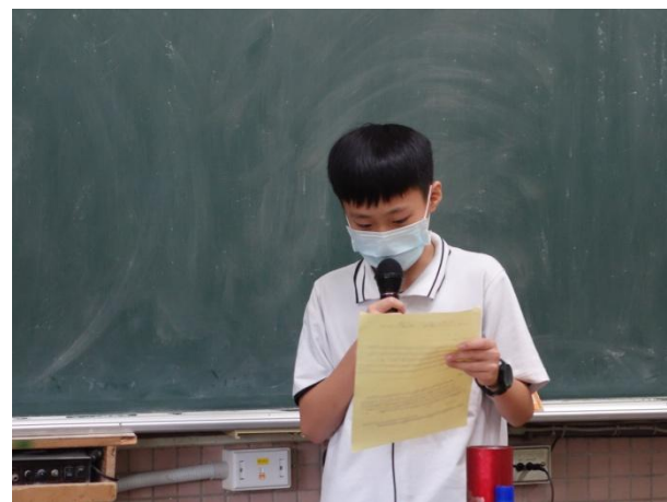
▲ 閱讀課程與寫作：學生上台分享心得內容(2)