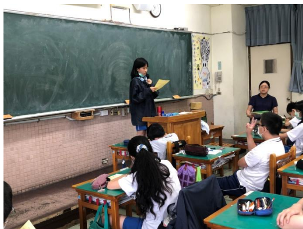
▲ 閱讀課程與寫作：學生上台分享心得內容(1)