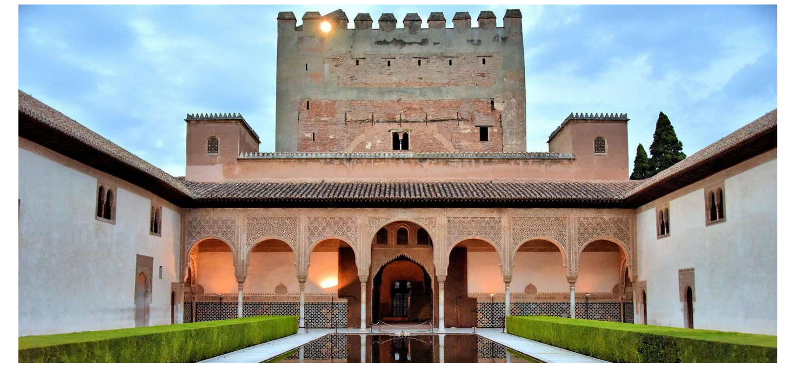
de los Arrayanes 香桃木院

https://www.alhambra.degranada.org/zh/info/%E7%BA%B3%E5%A1%E7%91%E9%69%E7%9A%E8%87%E5%AE%AB/%E8%AF%B8%E7%8E%8B%E5%8E%85.asp