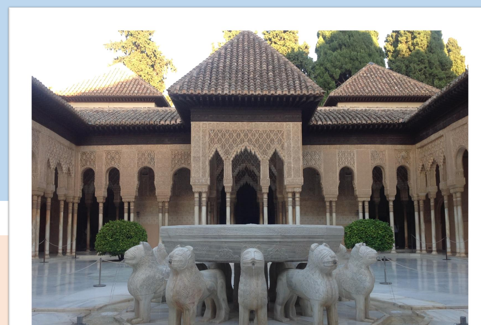
Patio de los Leones 獅子院

https://www.entradalahambra.es/blog/12-palacios-nazaries-granada-palacio-patio-de-los-leones-alhambra-visita-guiada