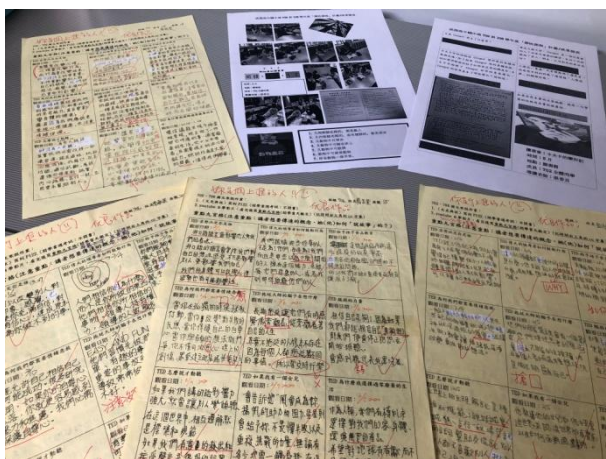
▲ 閱讀課程與寫作：學生閱讀後的手寫心得分享