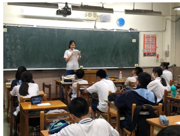
▲ 閱讀課程與寫作：同學上台分享閱讀心得