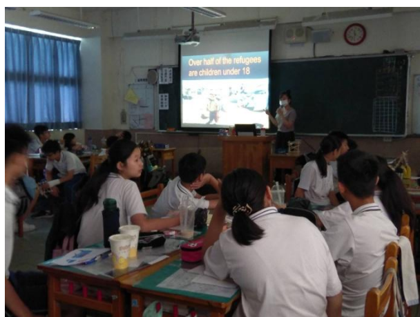
▲用英語看世界課程：分享國際事件(英文)