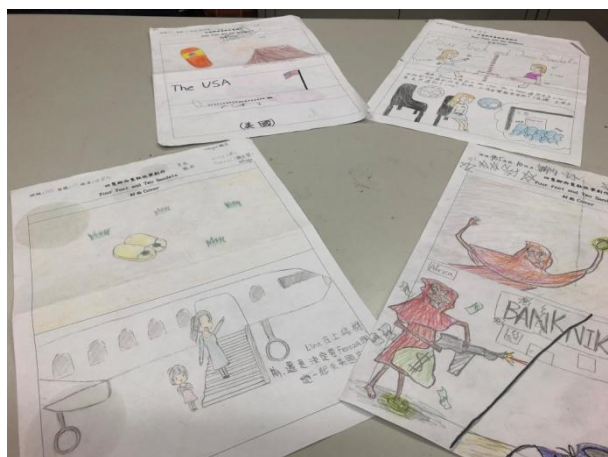
▲用英語看世界課程：學生自製英文讀本(1)