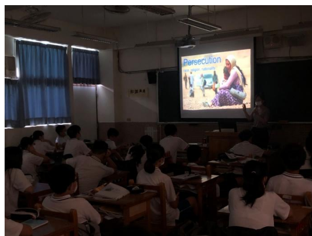
▲用英語看世界課程：將英文讀本與國際時事連結