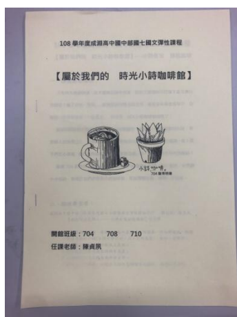
▲ 閱讀課程與寫作：學生創作詩集總集