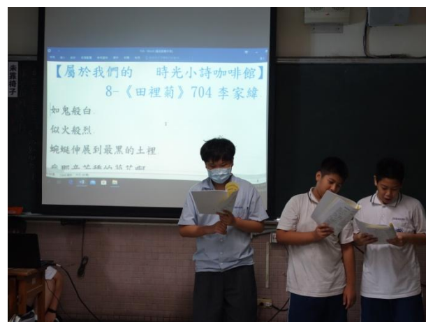
▲ 閱讀課程與寫作：同學上台朗讀分享自己的作品