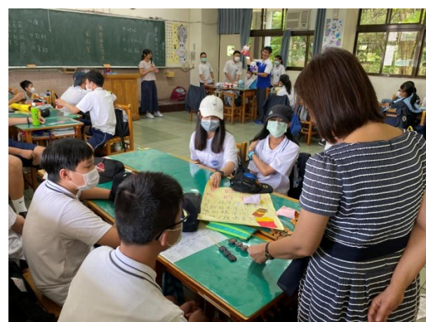
▲ 數學探究專題課程，校長、主任入班參與課程活動