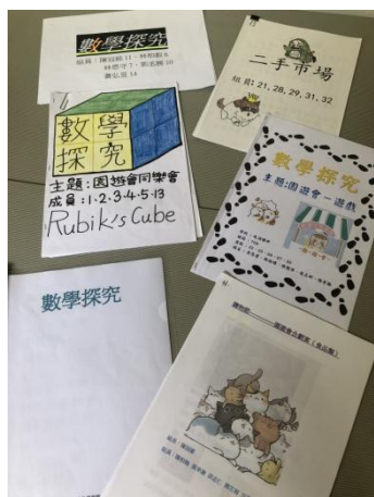
▲ 數學探究專題課程，學生自製活動企畫書