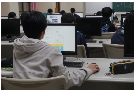
學生實際填寫情形