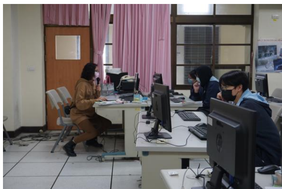
玉萍老師講解填寫步驟

主題： 模擬志願選填 時間： 112年1月3(星期二)至 1月6日(星期五) 地點： 電腦教室