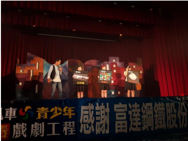
藉由道具可以讓學生更了解毒品種類