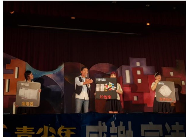
鐵蛋導演向學生說明毒品種類