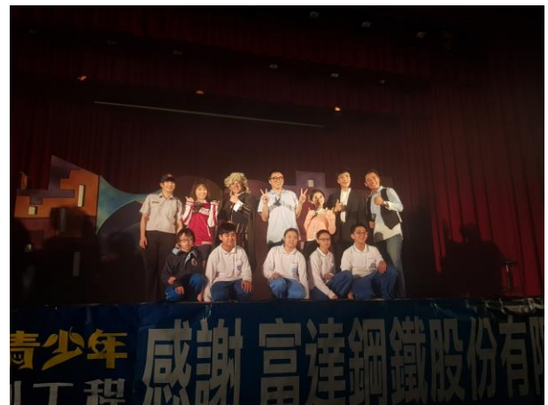
閉幕本校學生一同參予劇碼演出