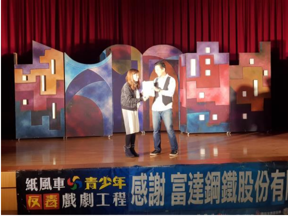
學務主任頒發感謝狀