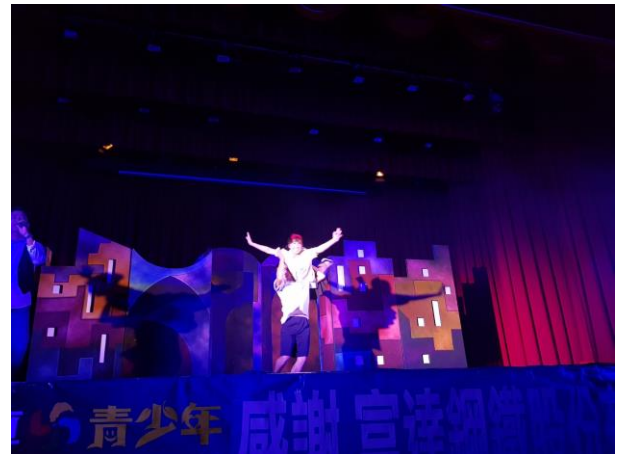
演員做出難度動作讓台下學生嘆為觀止