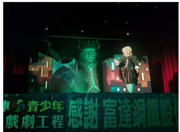
毒品危害健康，讓人生變黑白