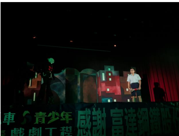
惡魔利用毒品控制吸食者