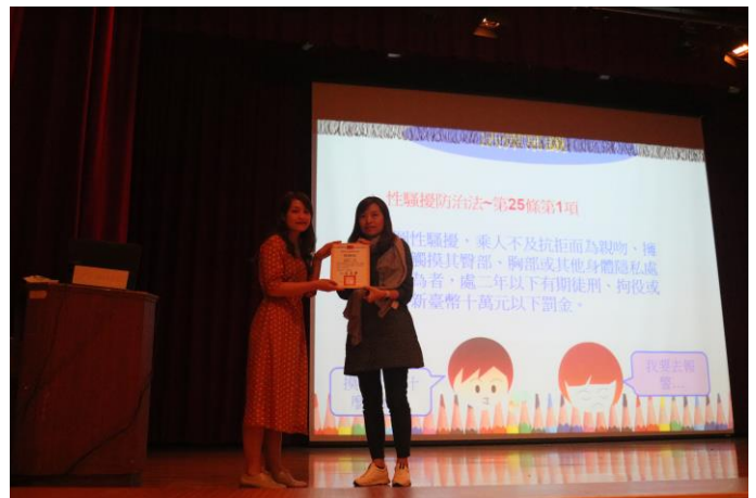
由學務主任代表學校致贈感謝狀