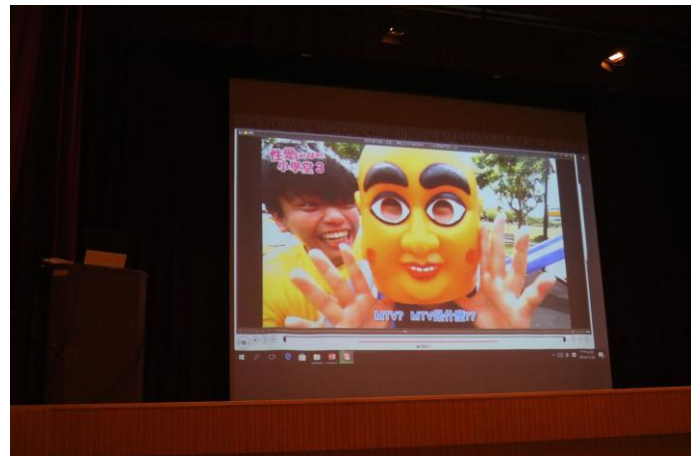
講師以學生熟知的網路名人切入主題