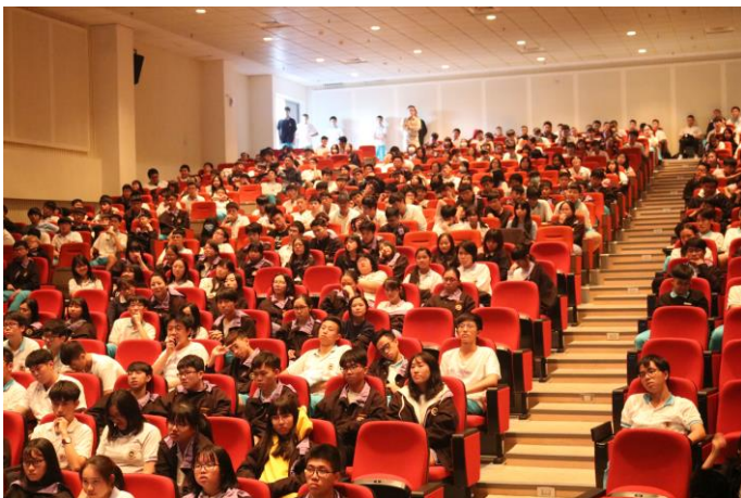
同學積極參與講座活動