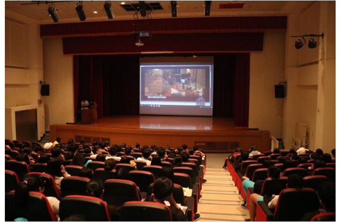
講師藉由影片討論相關主題