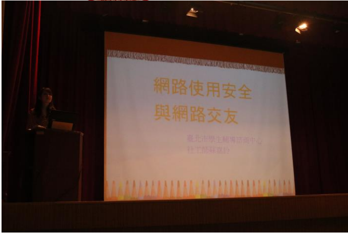
由社工主講法治教育議題