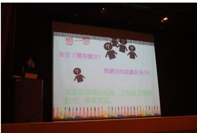
講師以生活中常發生的狀況切入主題