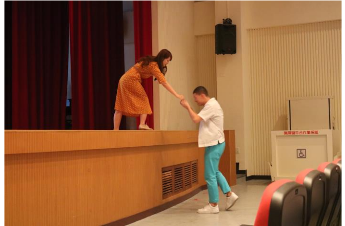
同學回答問題後，講師給小禮物