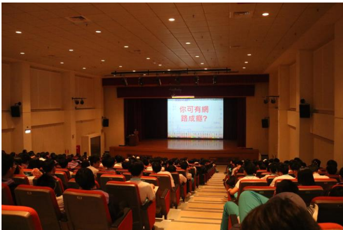
以提問讓學生思考