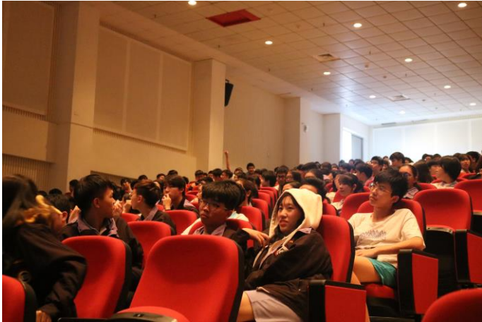
同學踴躍分享個人看法