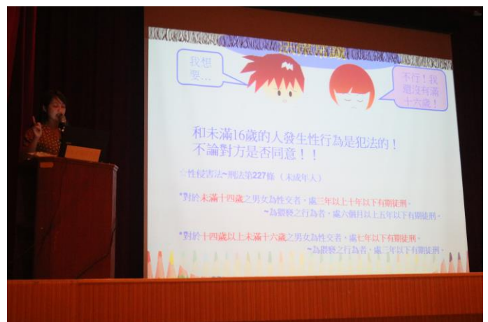
講師親切向學生宣導