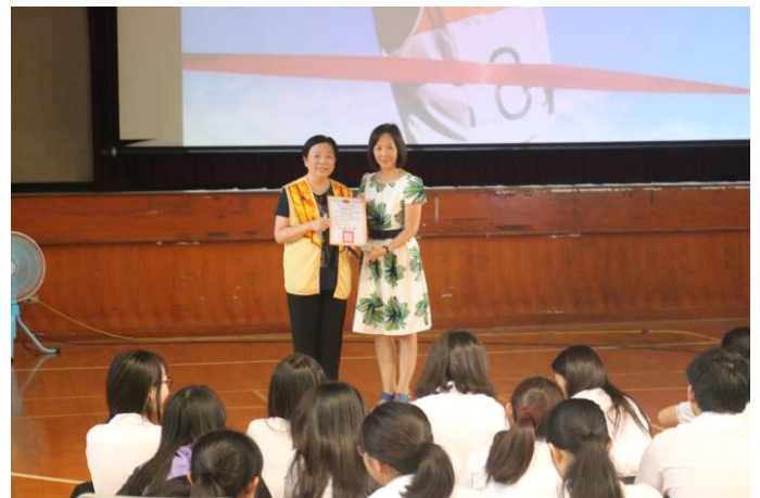
由校長致贈感謝狀