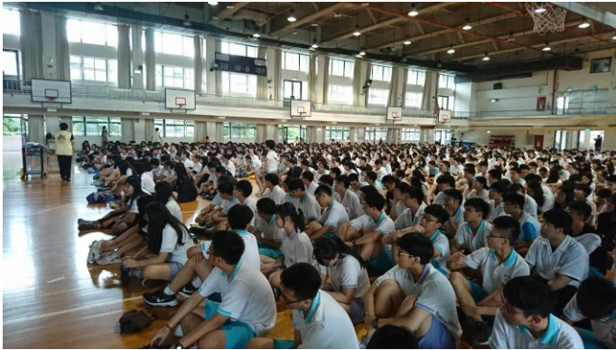
全體同學認真參與課程