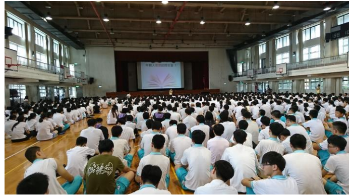
以書本為主題讓同學參與討論