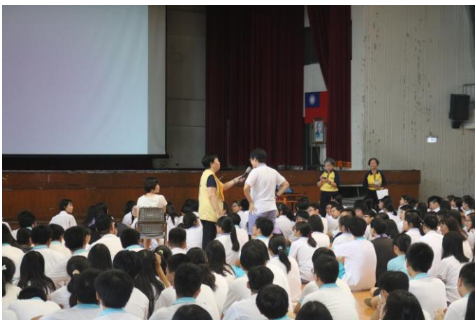
講座現場氣氛熱鬧