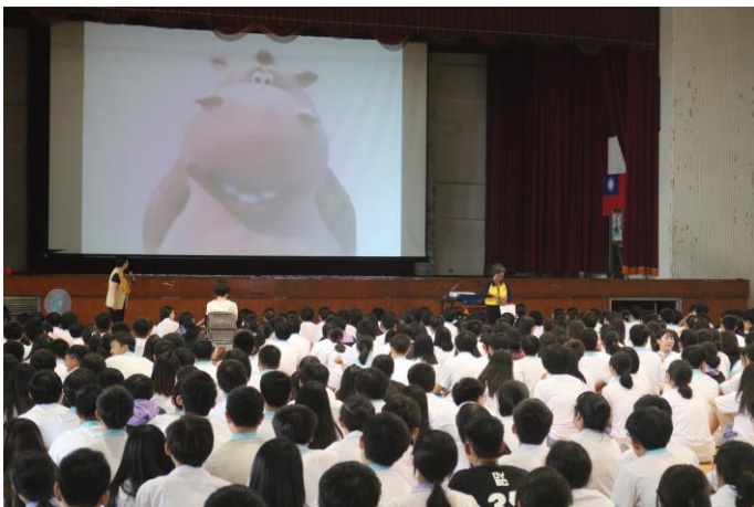
以生動的動畫引起同學興趣