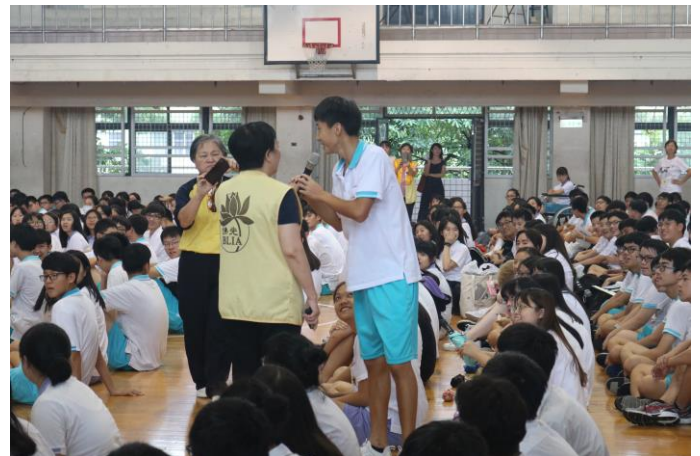
講師以互動的方式請學生分享