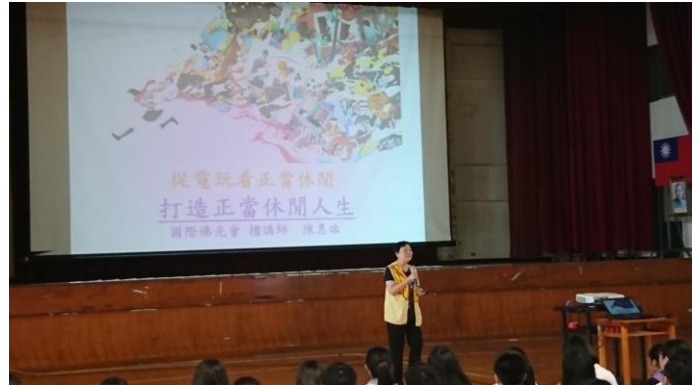
講師講座內容符合主題且貼近生活