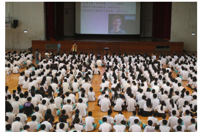
以同學了解的臉書創辦人引發討論