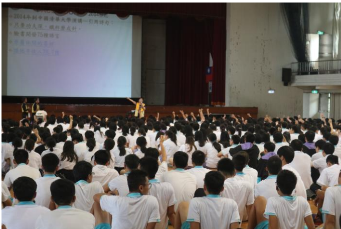
參與同學熱情回應