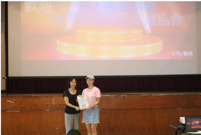
由學務主任代表學校致贈感謝狀