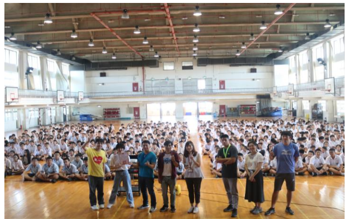
藝人團體與全體參與學生大合照