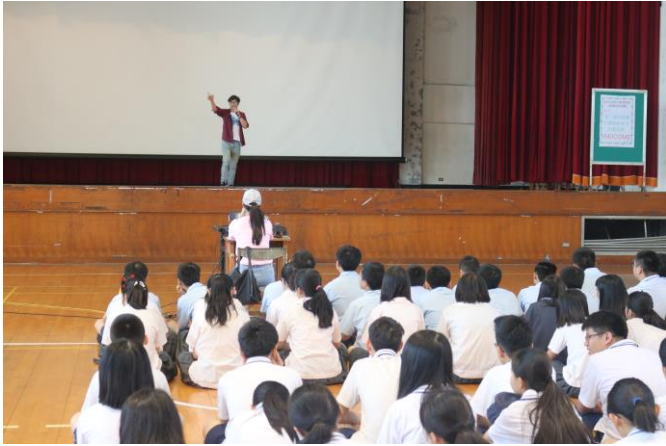
由知名藝人引導同學腦力激盪