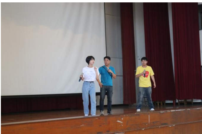
講師演出生動活潑