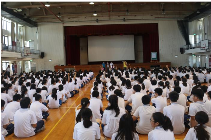
講師與同學們互動熱絡