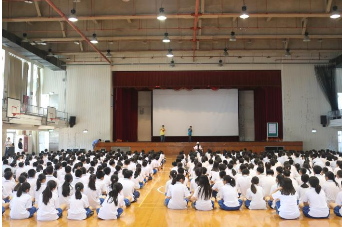
由藝人團體主講友善校園議題