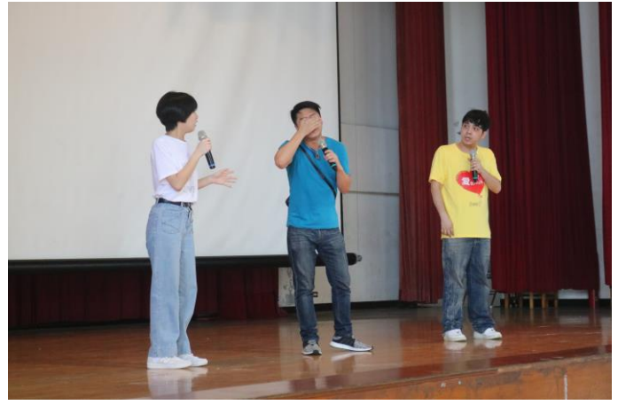
短劇搭配精彩音效，符合主題且貼近生活