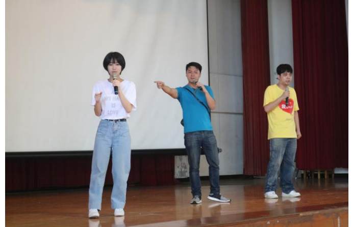
感謝藝人團體蒞校演出