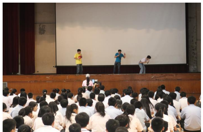
參與同學全神貫注於短劇