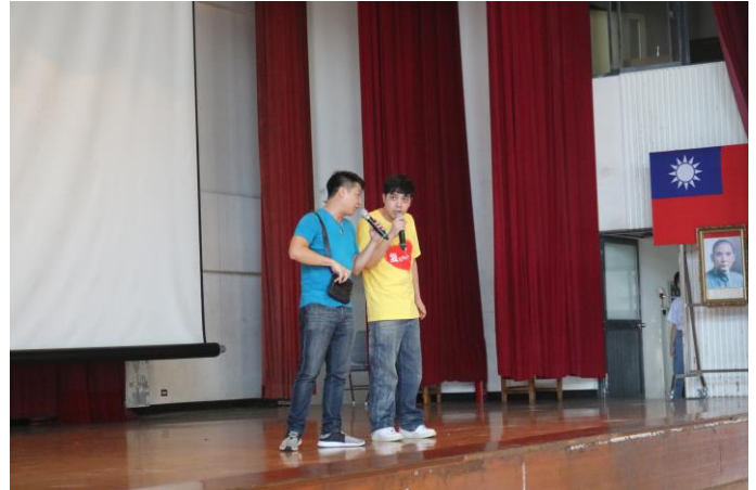
講師以詼諧有趣的方式切入主題