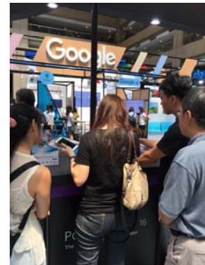
學習新軟體的介面操作