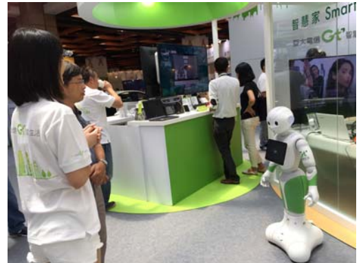
智慧生活科技參觀