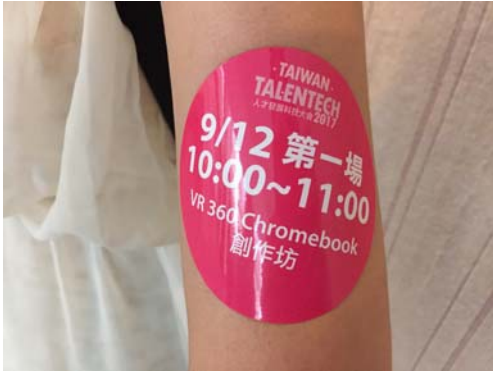
參與 VR360 創作坊