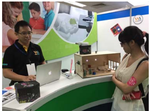
參觀數位科技展覽