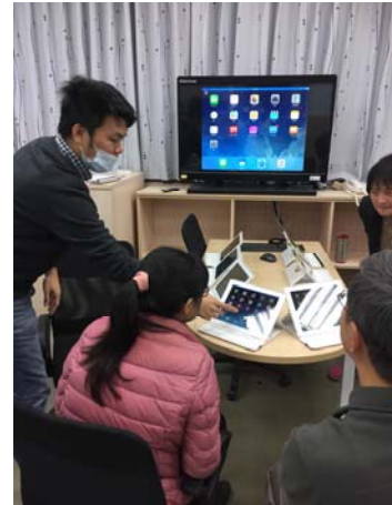
教學工具與連結應用