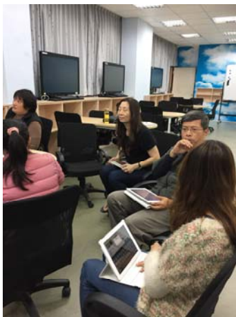
社群成員討論練習