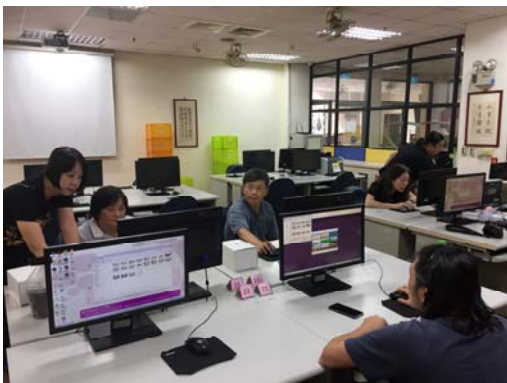
教師實際操作練習