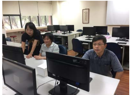
助教協助指導教師操作