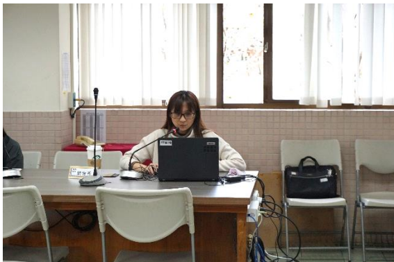
資料組長進行工作報告