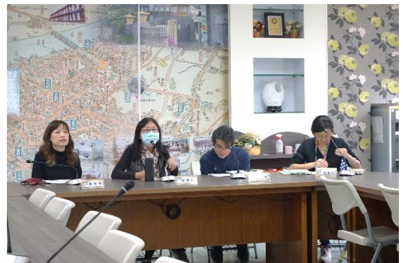
校長開場說明會議目的敘述