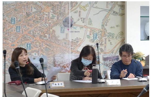
輔導主任補充說明