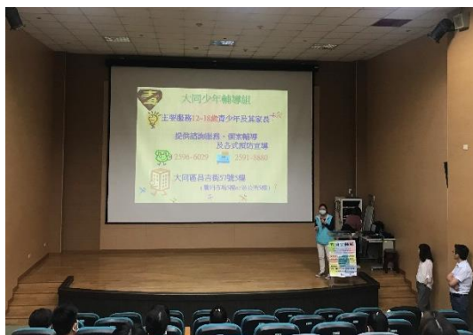
大同少年輔導組-與青少年i(愛)距離宣導