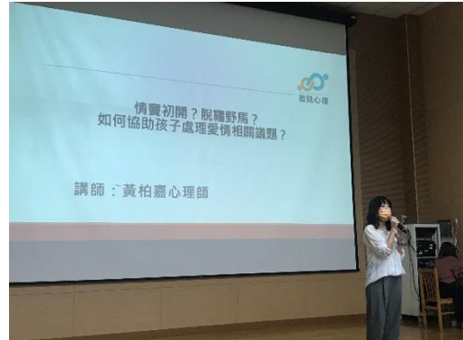
主任開場感謝家長參與講座