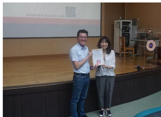
輔導主任頒發感謝狀