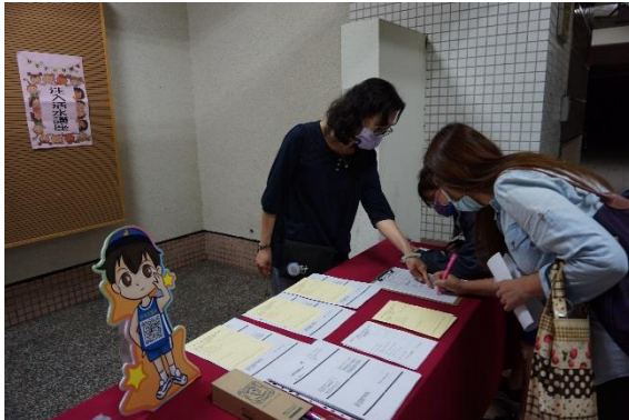
家長們進場簽到情況

主題：注入活水親職講座-情竇初開脫韁野馬!如何協助孩子處理愛情相關議題 時間：110年4月23日(五) 下午19:00-21:00 地點：多媒體教室