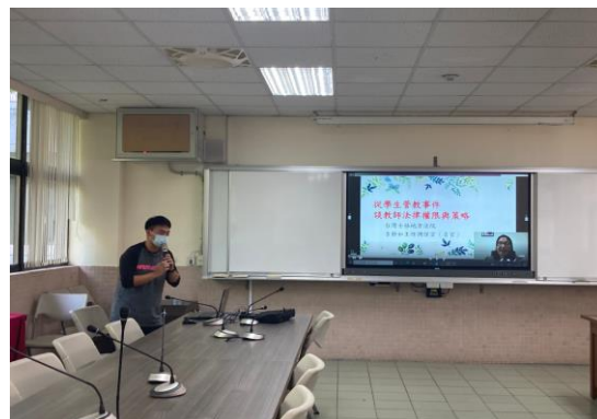
教官室開場介紹講師