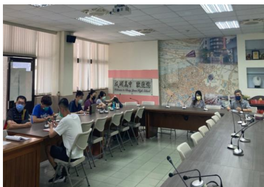
與會人員認真聽解