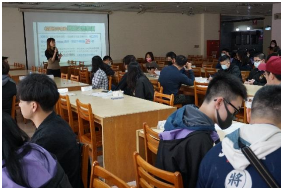
講師說明性平相關概念