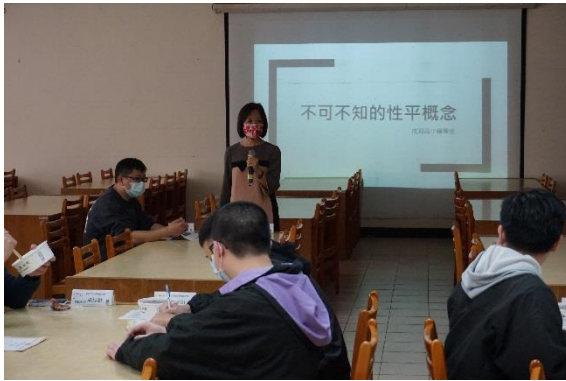
校長開場說明研習目的

主題：高中社團指導老師不可不知的性平概念 時間：110年03月05日(星期五) 下午12:00-13:00 地點：二樓圖書館