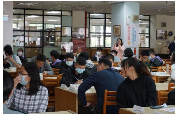
教師認真參與研習