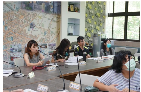
輔導主任補充說明