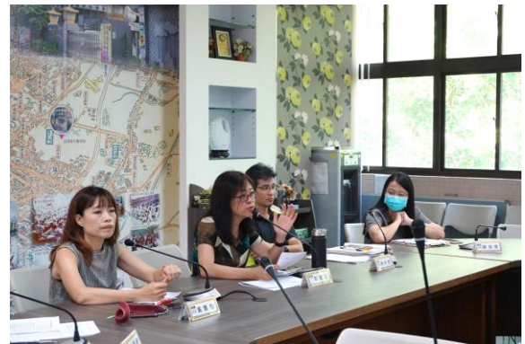
校長開場說明會議目的敘述