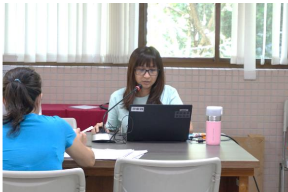
資料組長進行工作報告