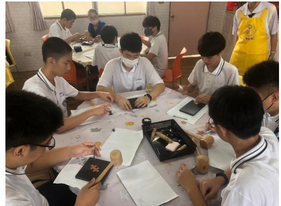
學生認真投入製作