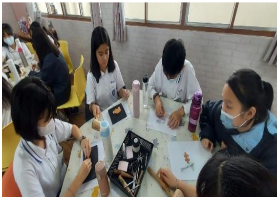
手作皮革鑰匙圈體驗