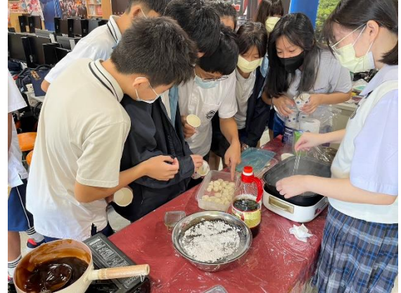
月見團子製作過程