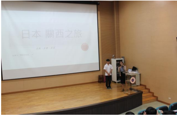
組長介紹本次行腳主題及主講人