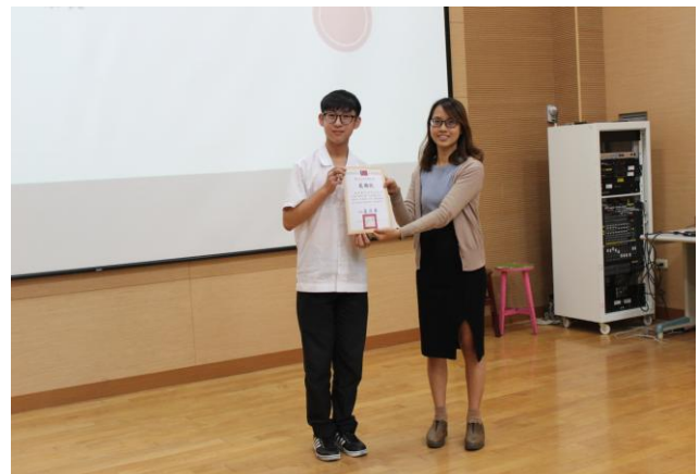
組長頒發感謝狀給主講人