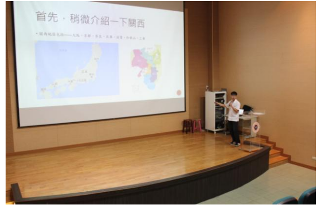
同學分享行腳經驗