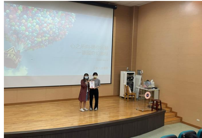
組長頒發感謝狀給主講人