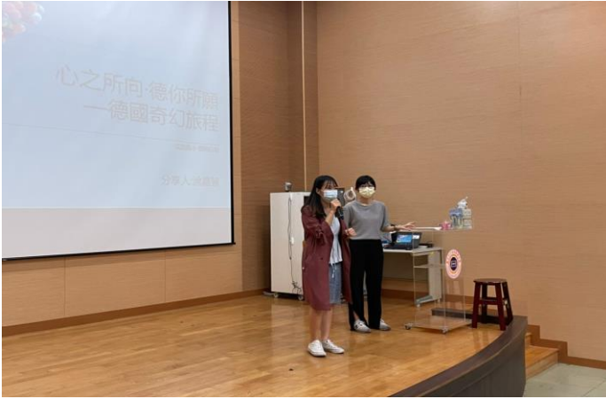
組長介紹本次行腳主題及主講人