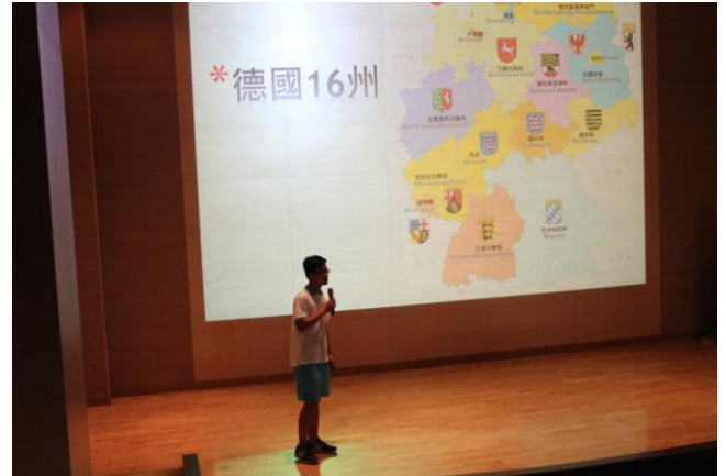
同學分享行腳經驗