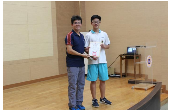
主任頒發感謝狀給主講人