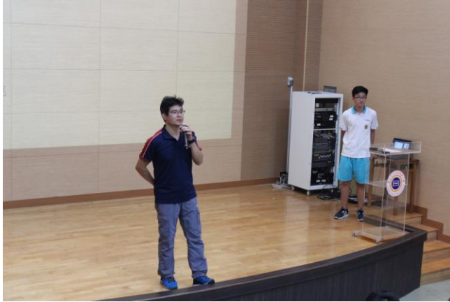
主任介紹本次行腳主題及主講人