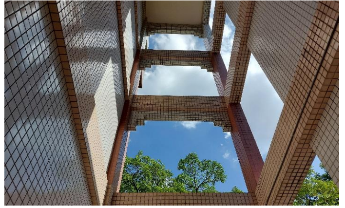
高中部參賽者佳作作品