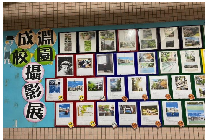
老師用心佈製攝影比賽作品展