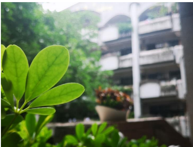
國中部優等攝影作品