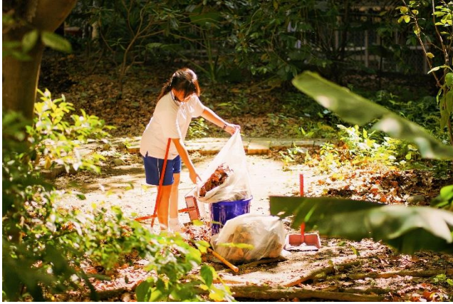
高中部參賽者佳作作品