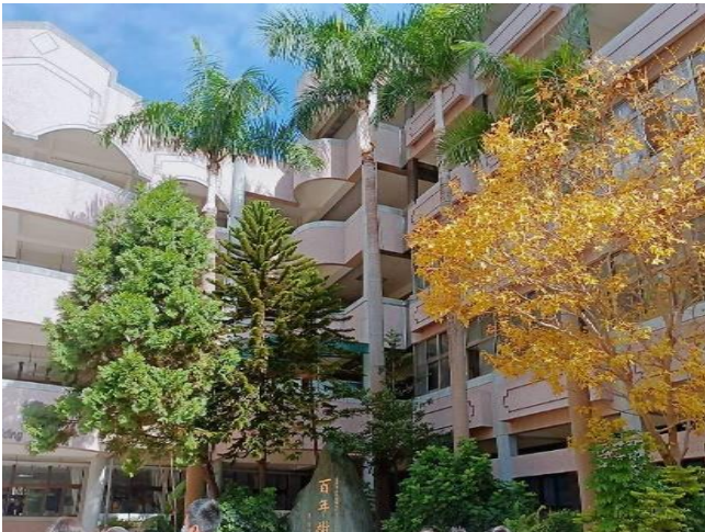
國中部參賽者佳作作品