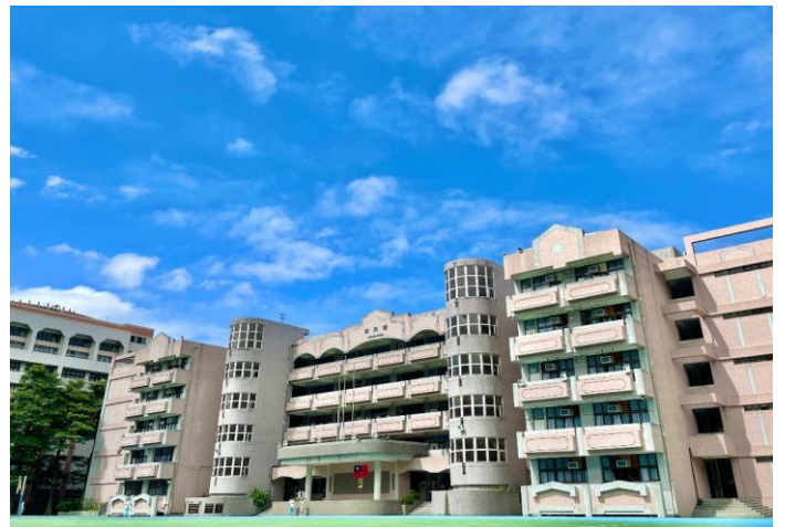
國中部特優攝影作品