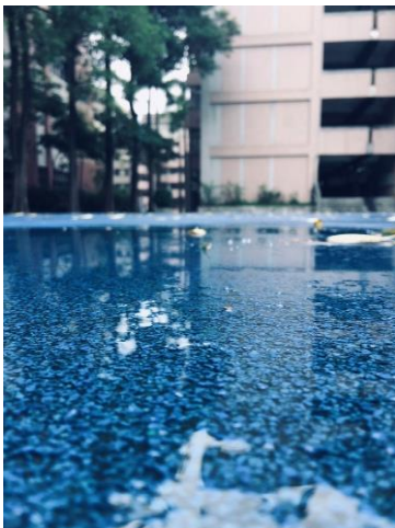
國中部特優攝影作品