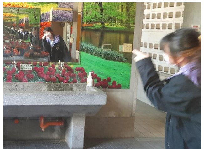
高中部優等攝影作品