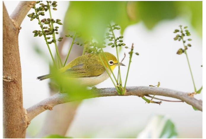
高中部特優攝影作品