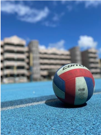
高中部特優攝影作品