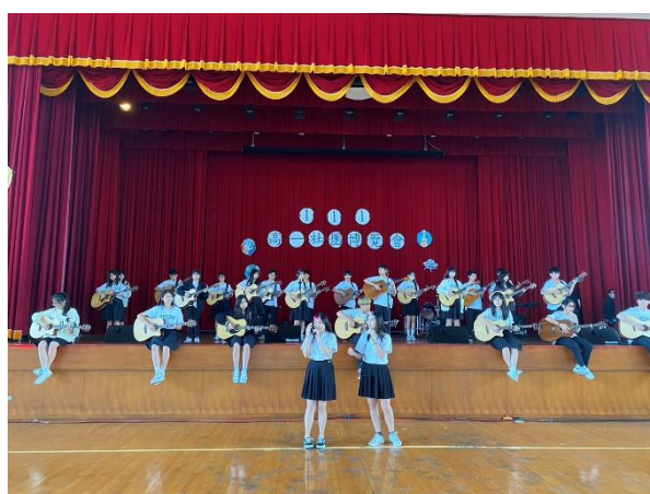
主持人與台下互動