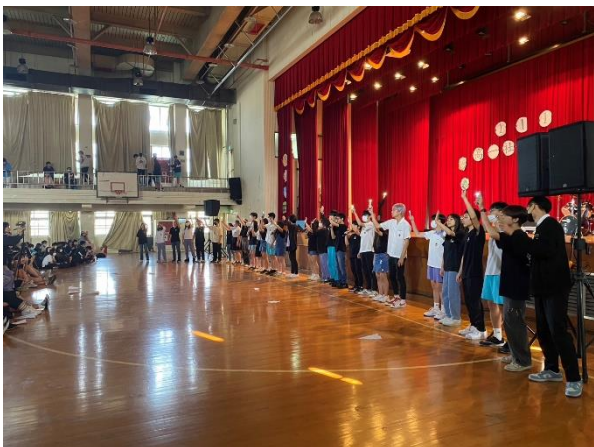
流音社與台下互動