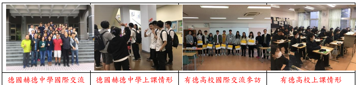
德國赫德中學國際交流

為了鼓勵高中教師與學生積極投入校本課程與議題探索課程發展，成淵規劃國內外參訪，並透過與日本有德高校、德國赫德中學姊妹校的國際交流，培植本校師生國際教育視野提升教學專業。另於109學年度辦理台加雙聯學制。