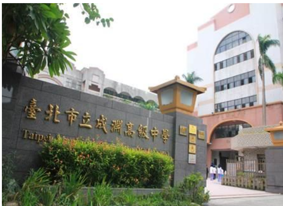
臺北市立成淵高級中學