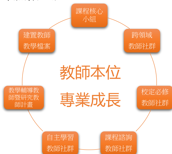
圖三 成淵教師本位成長活動系統