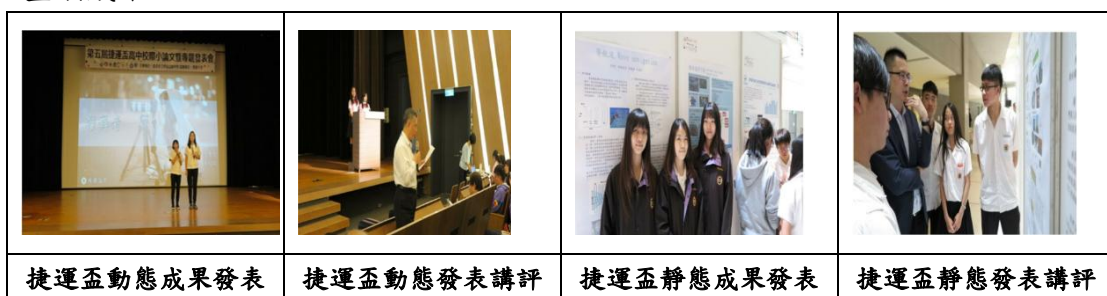
圖：捷運盃動靜態發表照片

此外因應108課綱，由本校教師社群自主發展充實（增廣）微課程（如：國英文寫作、縱橫數海、自然／社會探究與實作等課程。）於彈性課程實施。並鼓勵學生參加捷運盃高中校際小論文發表會，展現本校教師專業教學與學生學習之豐碩成果。