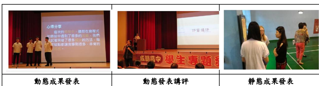
圖：成淵高中多元選修動靜態發表照片

此外因應108課綱，由本校教師社群自主發展充實（增廣）微課程（如：國英文寫作、縱橫數海、自然／社會探究與實作等課程。）於彈性課程實施。並鼓勵學生參加捷運盃高中校際小論文發表會，展現本校教師專業教學與學生學習之豐碩成果。