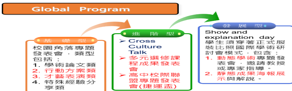
圖五、校本課程自信表進展模型

專題製作及自信發表的校本課程，運用原有之議題探索與專題製作課程為基礎，對課程進行滾動式的補強及修正，對應大學18學群之課程內涵。運用前瞻計畫中對彈性學習課程及團體活動進行高中三年系統性之規劃，達到108課綱自主行動、溝通互動與社會參與之素養。