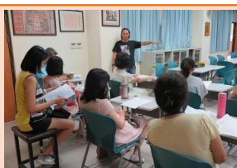
英文科老師入班觀課