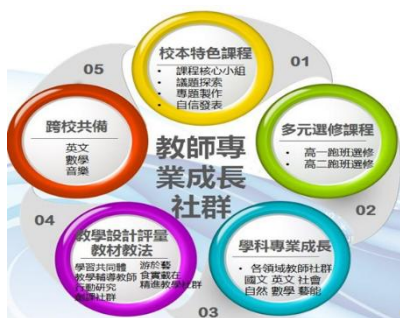
圖一、教師專業成長社群圖

2. 本校教師在領先與前瞻計畫的基礎之下，行政持續推動教師專業學習社群，教師參與教師專業社群主要的目標在完成下列任務：