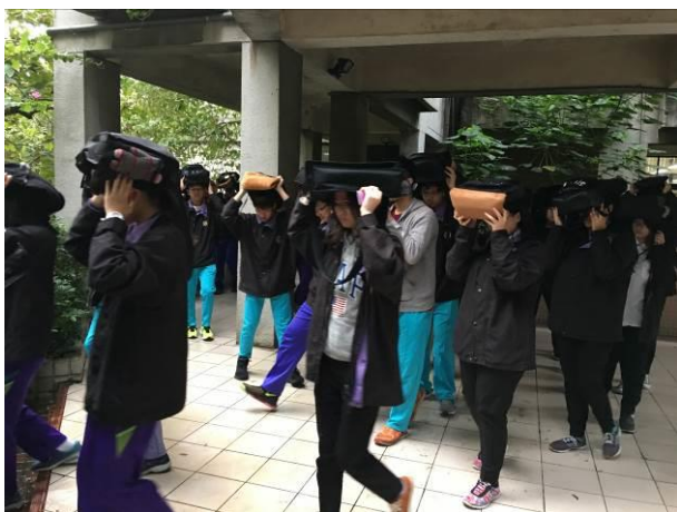
高中部同學疏散至烤肉區