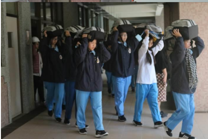
國中部同學疏散至指定地點