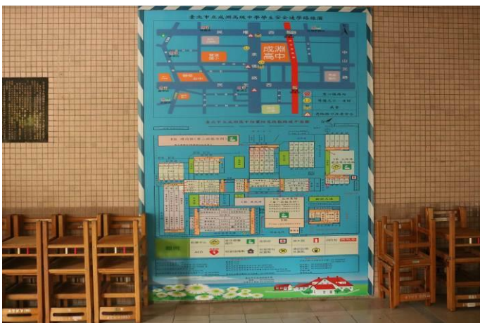
設置學生安全通學路線圖與校園疏散路線平面圖(總務處旁)