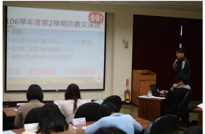
國中部導師會報防災宣導