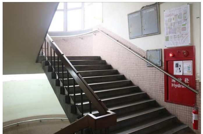
重大路口設置校園防災疏散圖