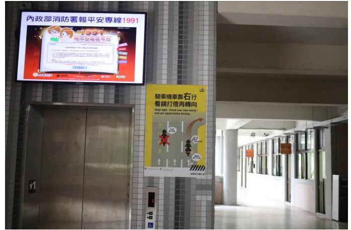
1991 報平安專線相關媒體宣導