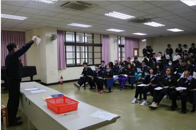
高中部防災小老師教育訓練