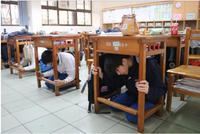
國中部同學防震災演練