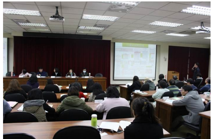
高中部導師會報防災宣導