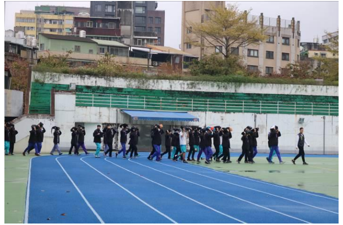
高中部同學疏散至大操場