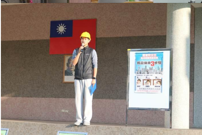
國中部生教組長於朝會防災宣導