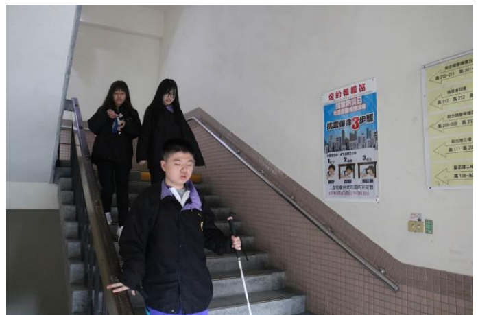
重大路口資訊宣導措施