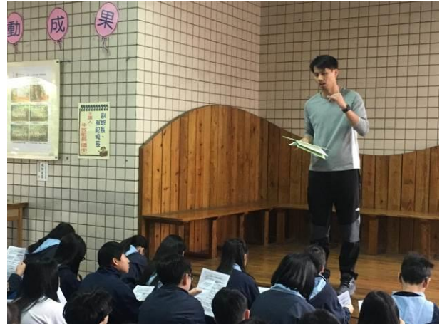
國中部防災小老師教育訓練