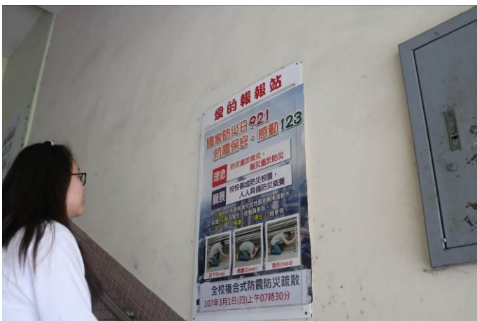
重大路口資訊宣導措施