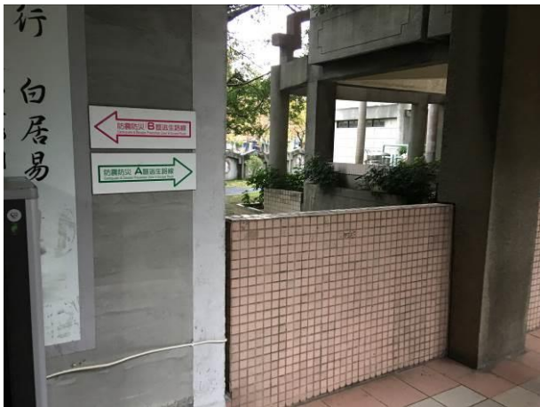
設置防災疏散指標