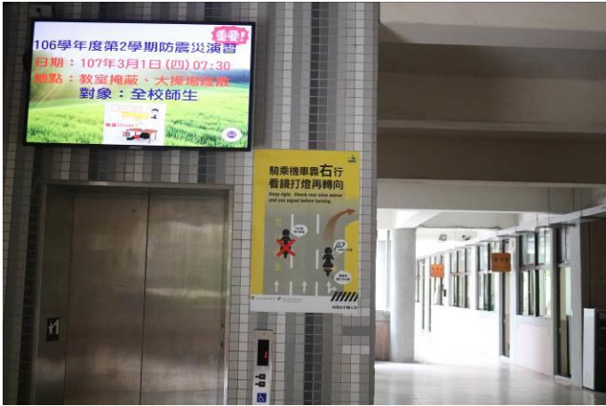
防震災演練相關媒體宣導