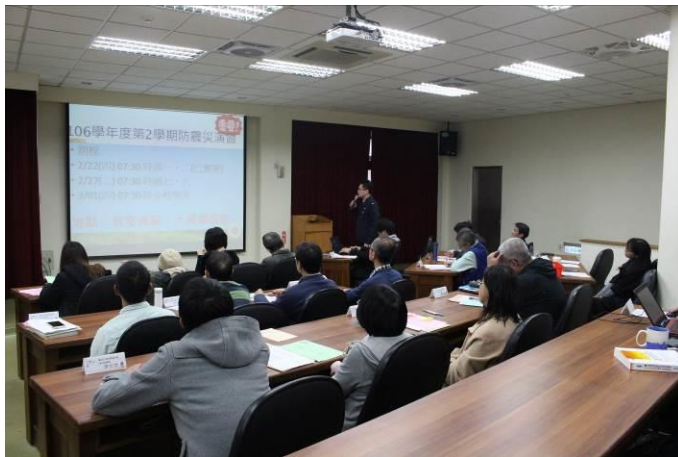
高中部導師會報防災宣導