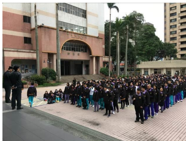
高中部同學疏散至成淵廣場