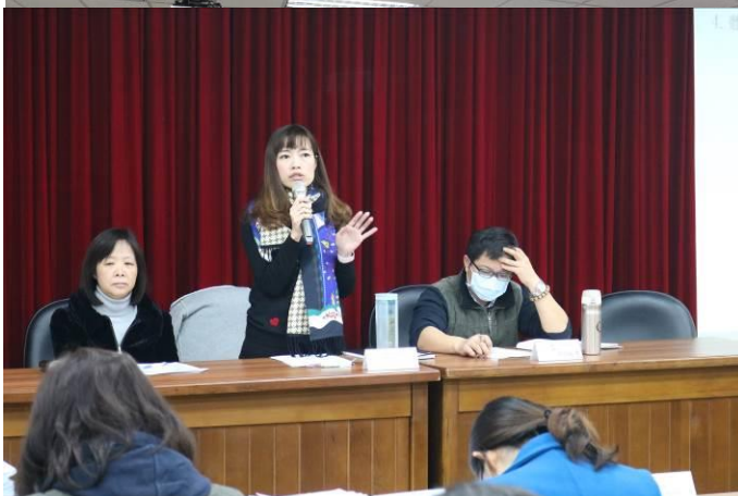
學務主任防災宣導