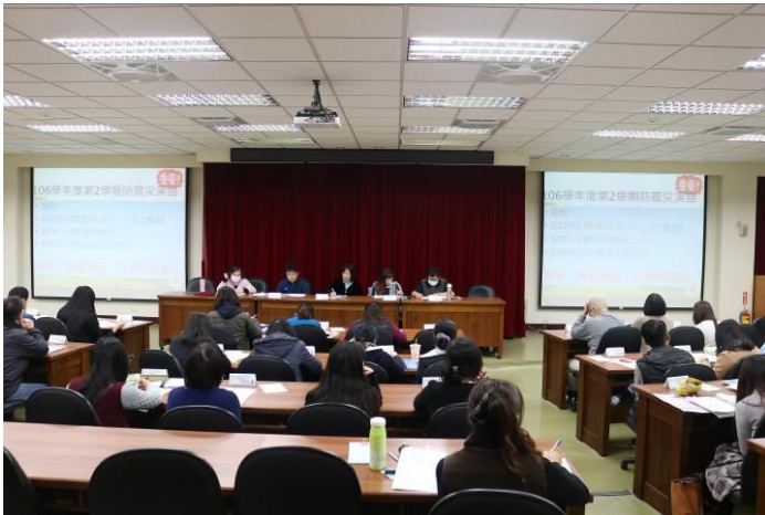
國中部導師會報防災宣導