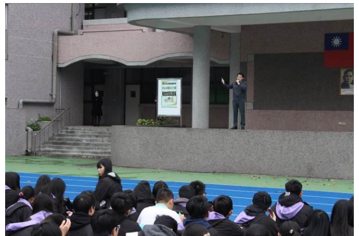
主任教官針對本次防災演練總檢討