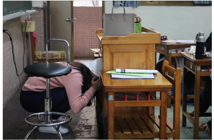
國中部導師一同進行防震災演練