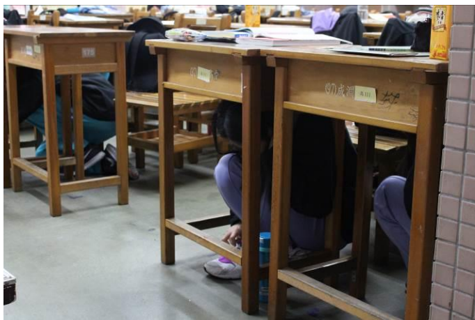
高中部同學防震災演練