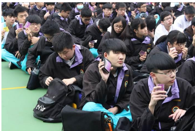
同學隨身攜帶家庭防災卡