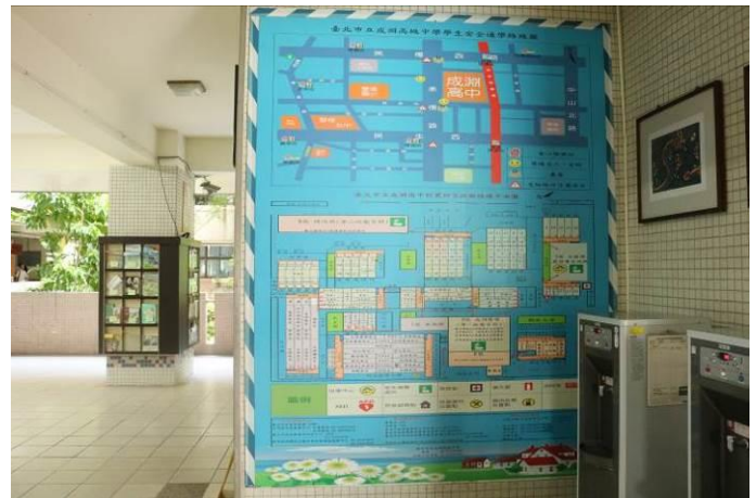
設置學生安全通學路線圖與校園疏散路線平面圖(健康中心旁)