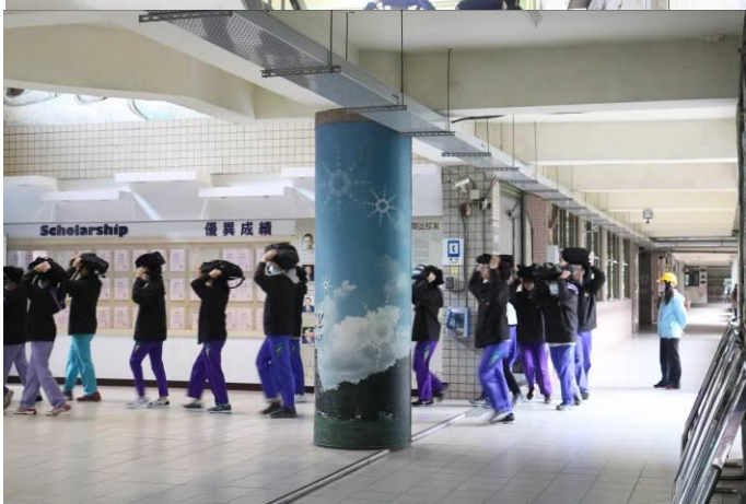
高中部同學疏散至成淵廣場