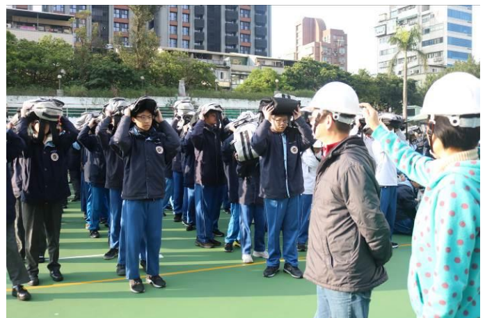
疏散至大操場，由導師點名