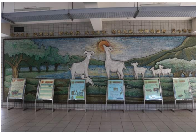
重大路口資訊宣導措施