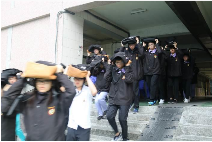
高中部同學疏散至大操場