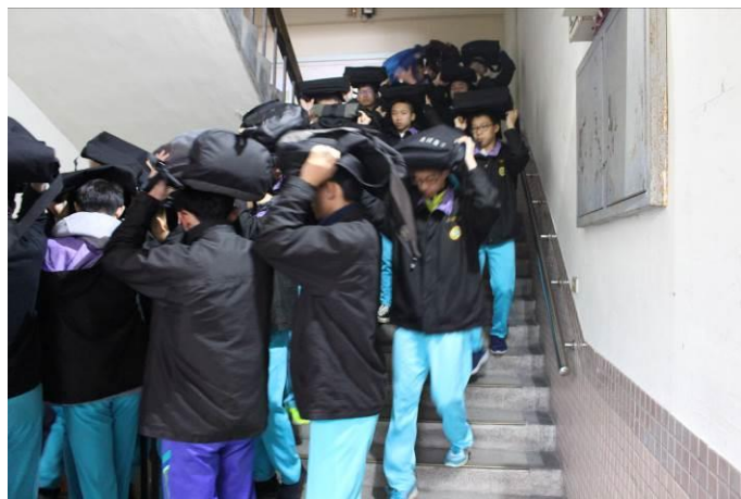
高中部同學疏散至指定地點