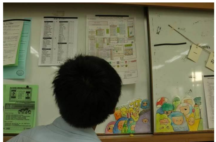
於班級設置校園疏散路線平面圖