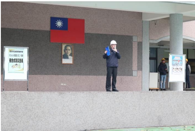
生輔組長針對本次防災演練檢討