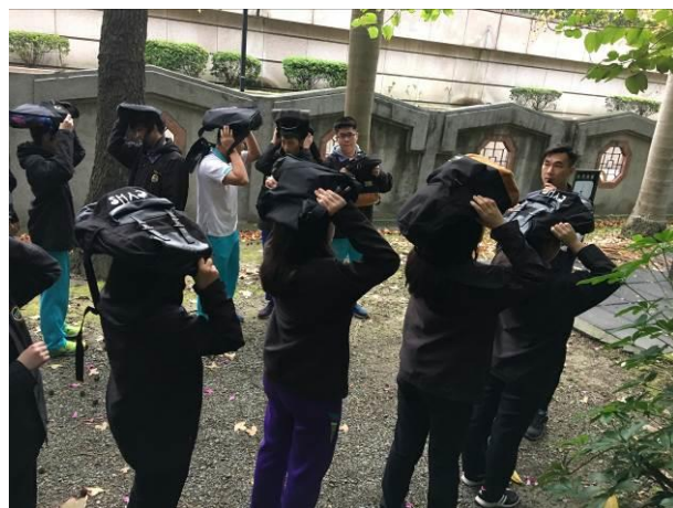
高中部同學疏散至烤肉區