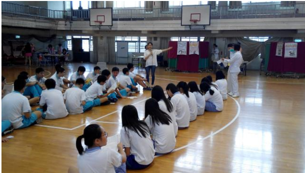
健康檢查前說明注意事項