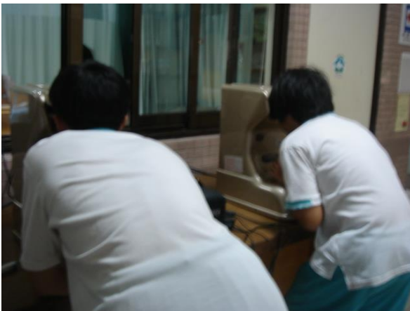
身高體重檢查實況