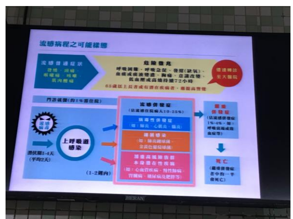
流感衛生教育宣導