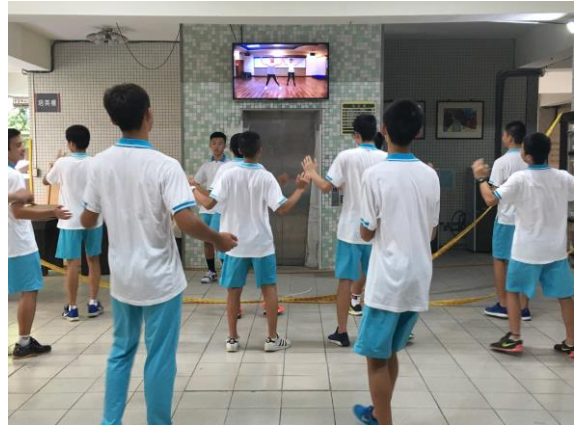
SH150 健康操大家一起來