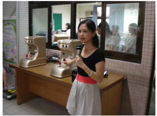
說明身高體重檢查注意事項