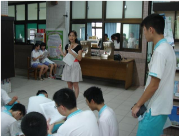
身高體重檢查前說明流程