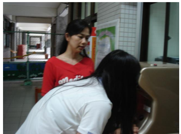
身高體重檢查實況