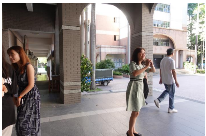
校長、處室主任、迎接新生