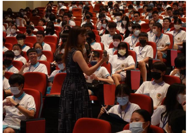
輔導主任介紹生涯規劃、學習歷程檔案