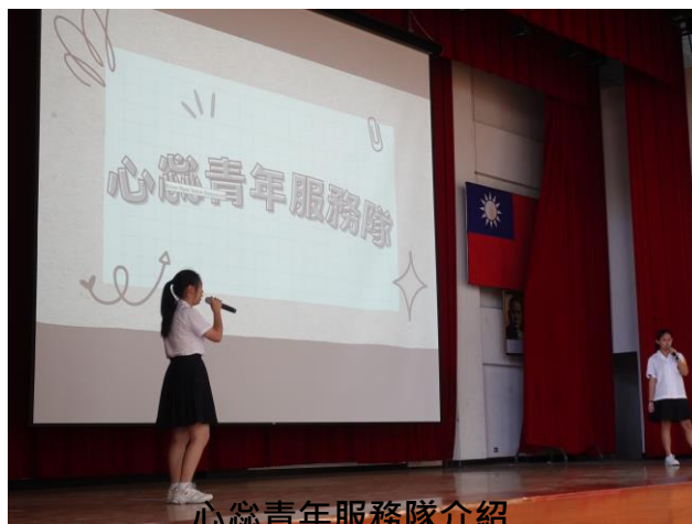
心蕊青年服務隊介紹