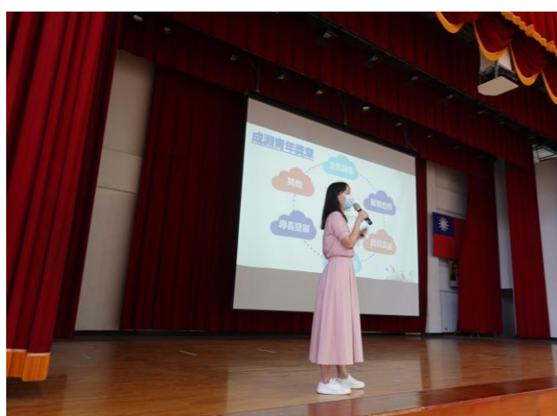
訓育組長說明青年獎章暨服務學習