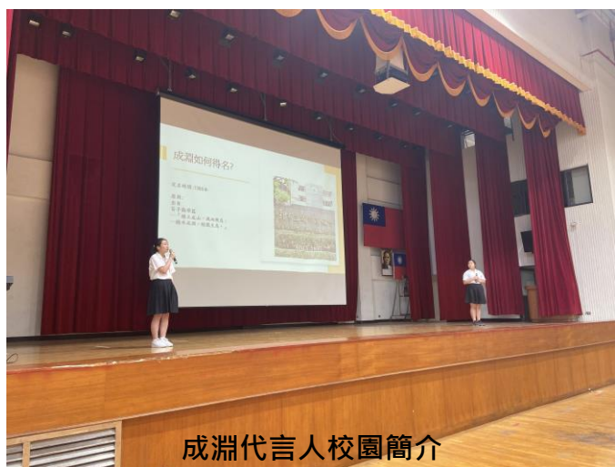
成淵代言人校園簡介