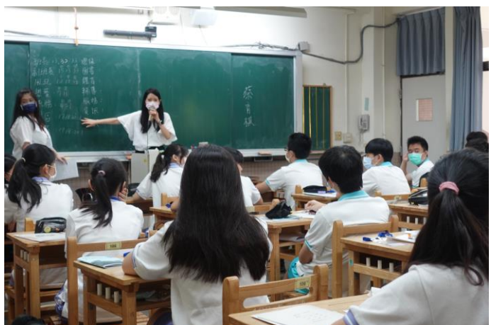
導師進行班級經營