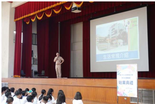
高中生活常規宣導