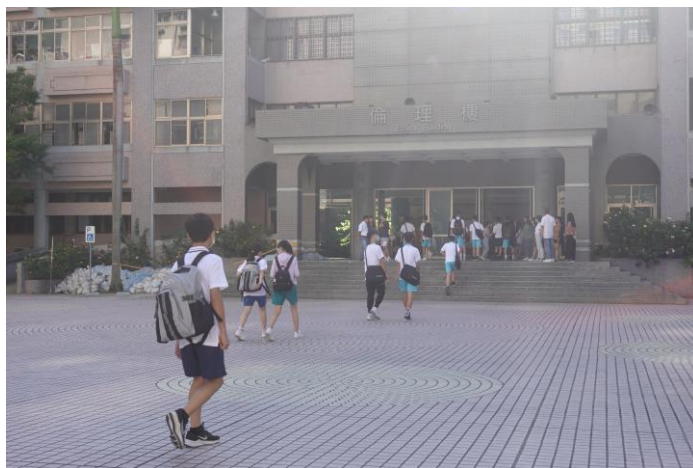
新生參加新生始業輔導