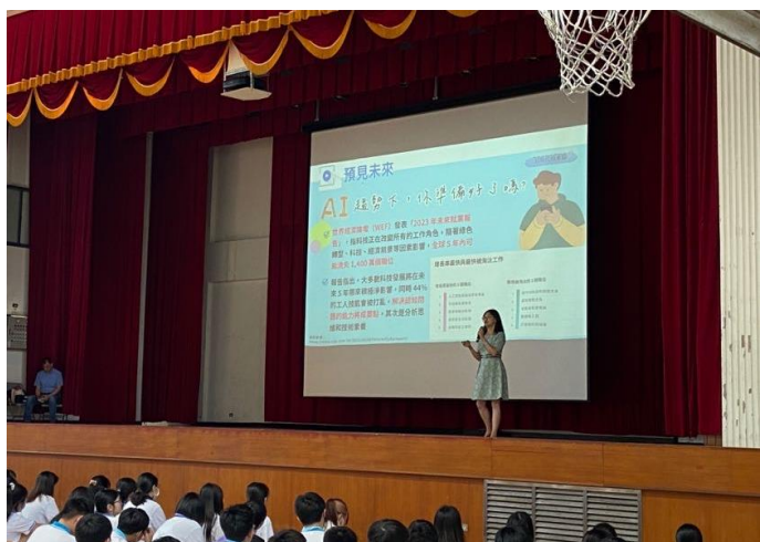
校長說明學校經營理念