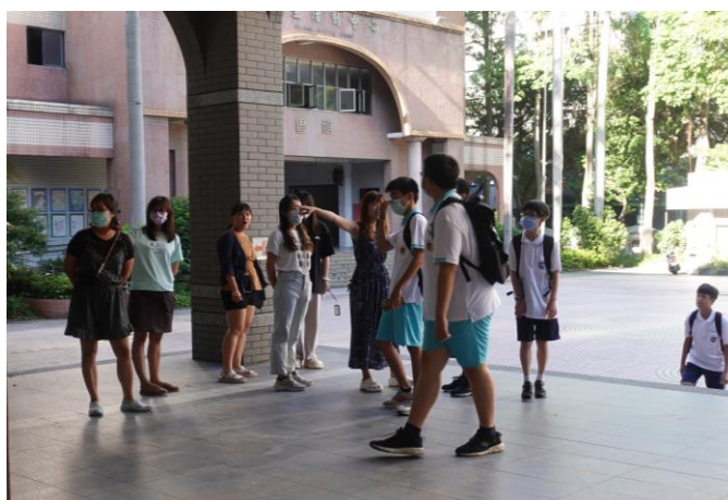
學校師長協助指引新生入班