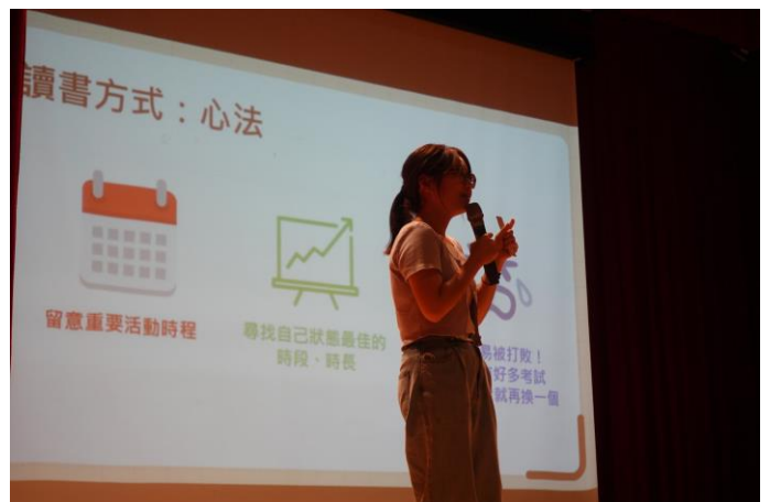
實習老師分享讀書方式