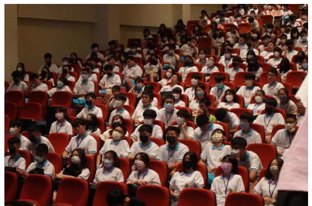
學生聆聽各處室工作介紹