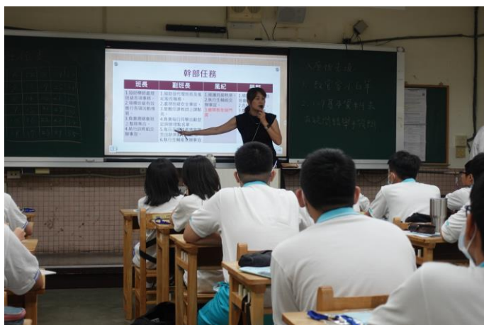
導師進行班級經營