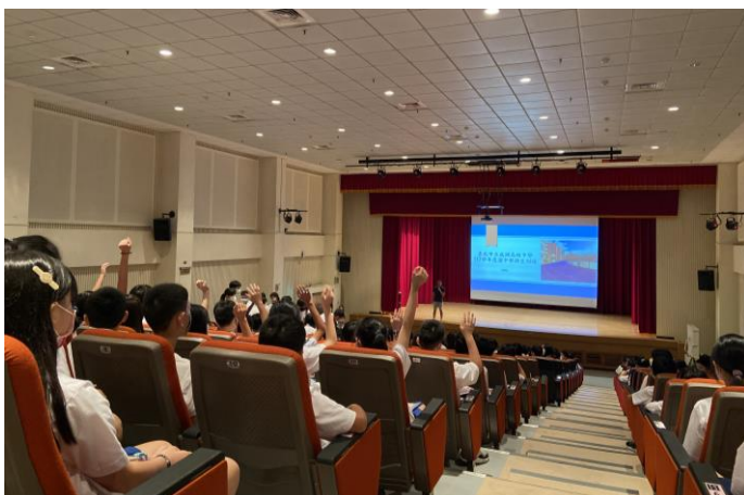
國中部生常規訓練