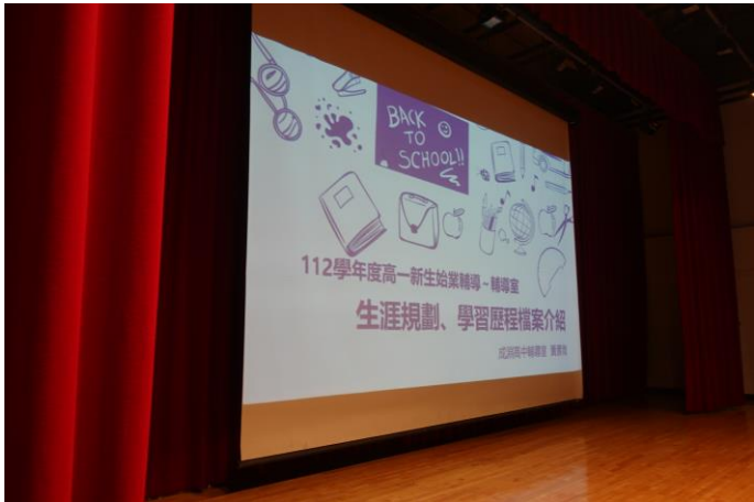
輔導主任介紹生涯規劃、學習歷程檔案