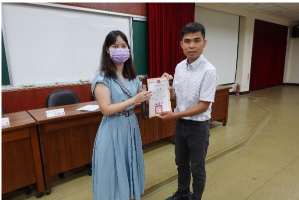
頒發本次活動講師聘書