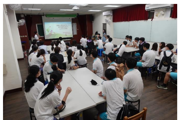
小組討論與問題思考