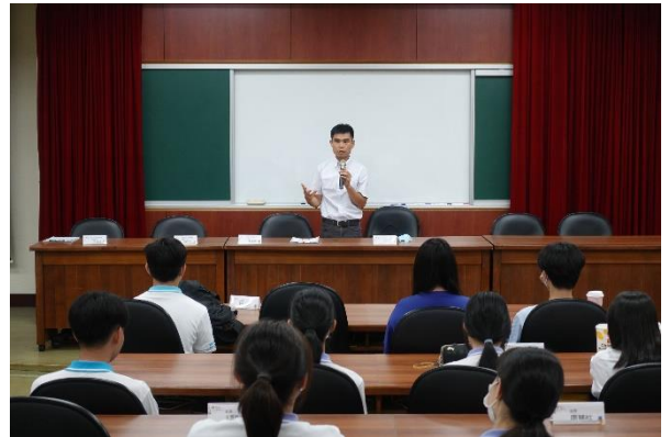
講師自我介紹與課程說明