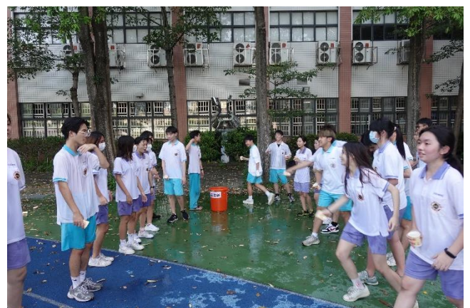
戶外團康探索活動：水世界-團隊凝聚力