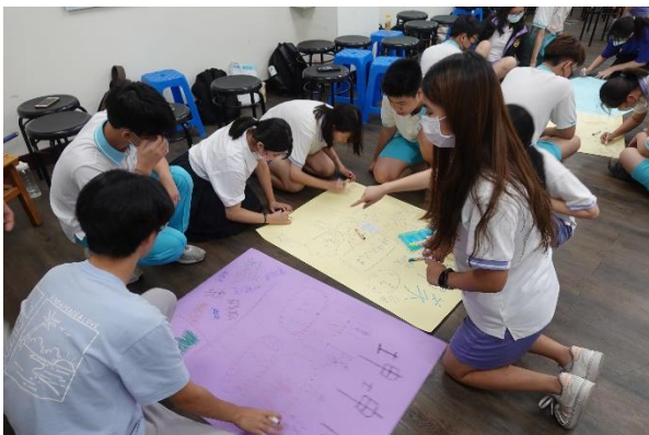
小組擬定發表海報