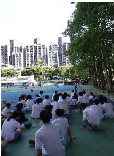
戶外團康探索活動說明