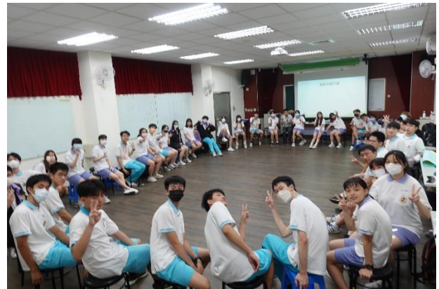
室內團康探索活動-大風吹、小風吹、經驗吹 隨意吹與師生大合照