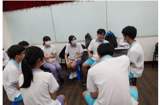
小組問題思考與解決方式討論