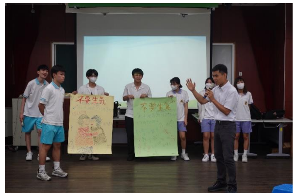
小組發表與回饋團隊核心精神與理念