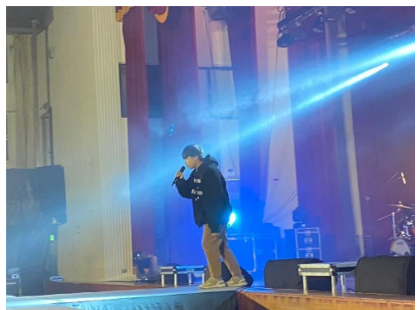
流音社表演者學習展現舞臺魅力