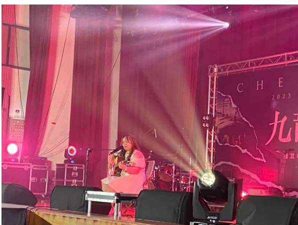
流音社表演者展現美聲與琴藝