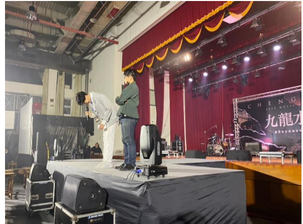
班聯會主席致詞並感謝大家