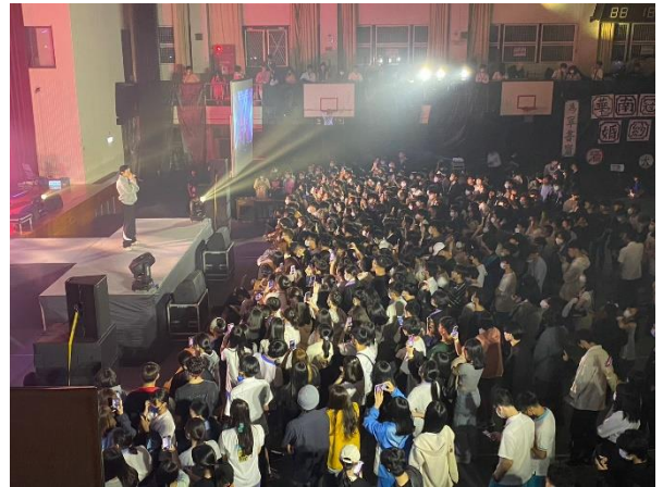
歌手黃號表演，吸引觀眾聚集