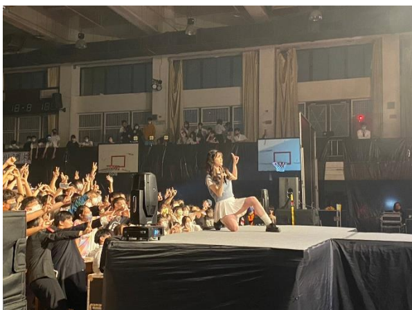
神秘嘉賓與大家合影