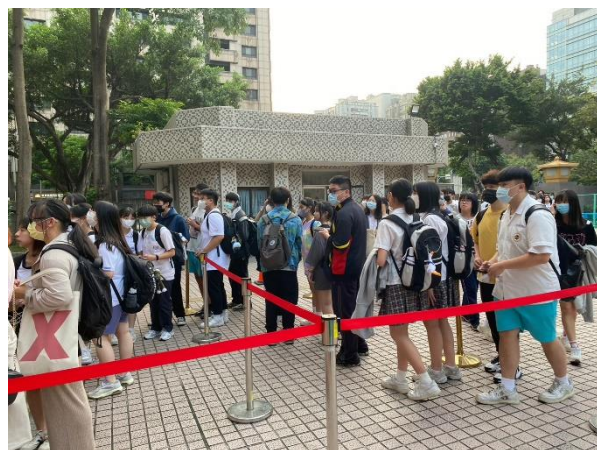
成淵廣場依指示入場