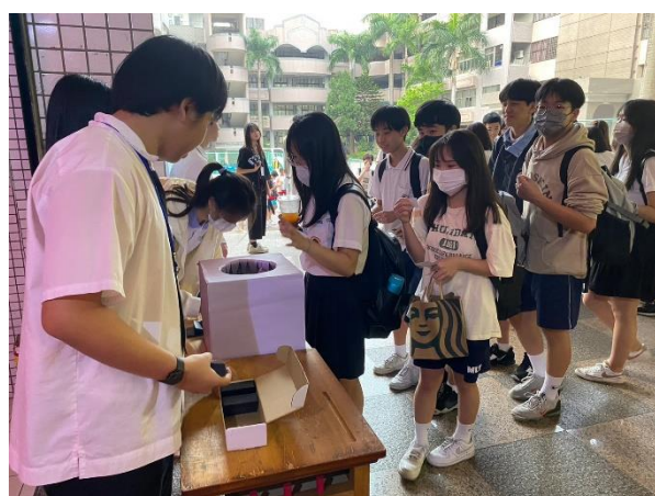
驗票後投入抽獎卡入場