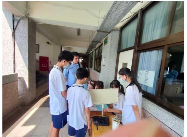
學生協助引導班級家長