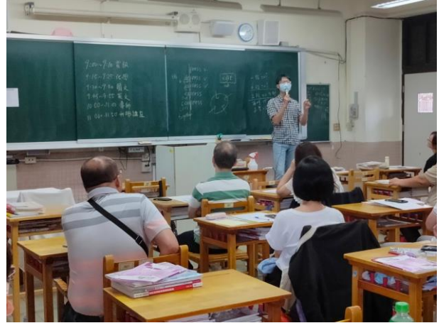
高中部導師向家長介紹說明