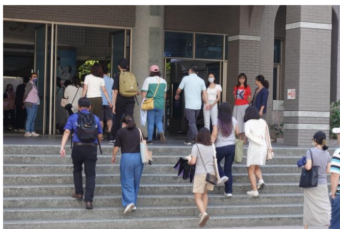
家長入校參與學校日座談會