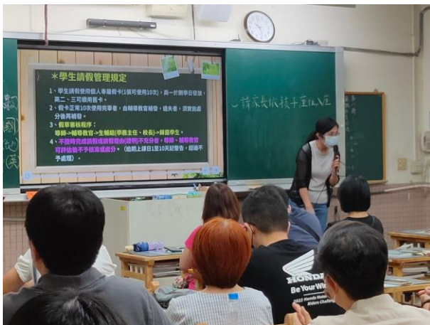
高中部導師向家長介紹說明