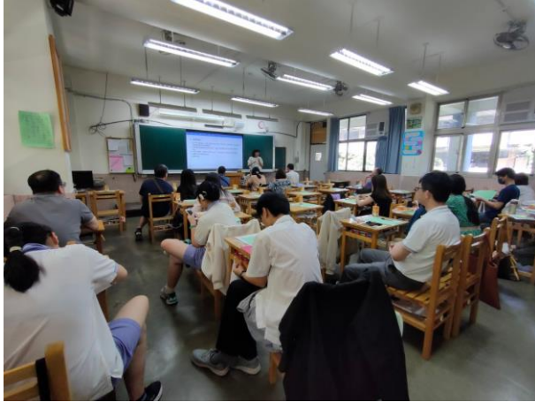
高中部導師向家長介紹說明