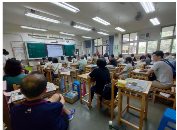
家長參與班級座談會