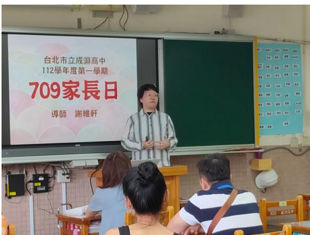
國中部導師向家長介紹說明