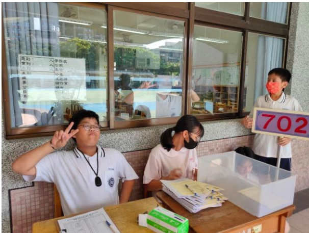
學生協助引導班級家長