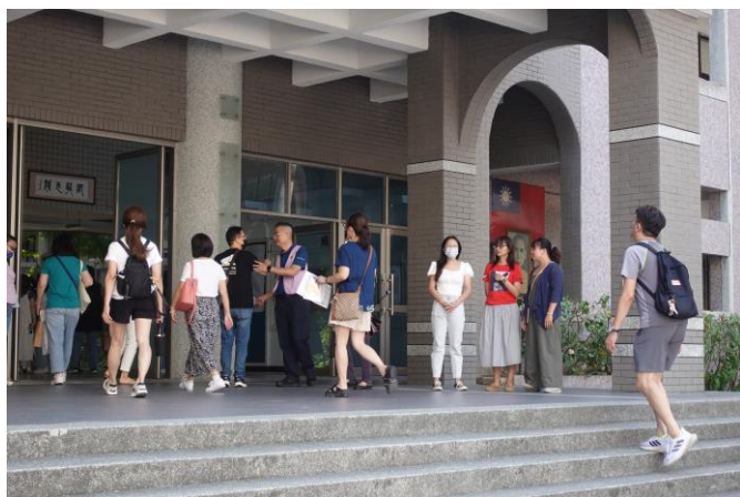
輔導室成員暨家長志工迎接家長