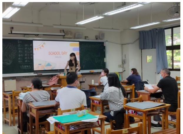
國中部導師向家長介紹說明