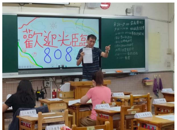
國中部導師向家長介紹說明