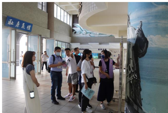
家長志工暨各組組長協助引導家長入班