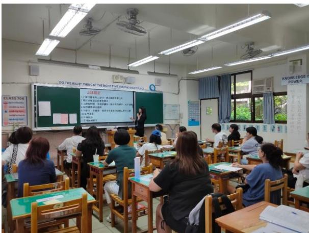
國中部導師向家長介紹說明