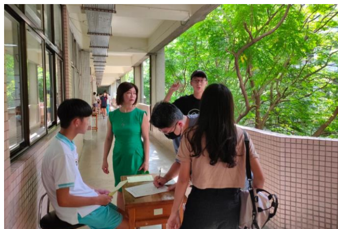
學生協助引導班級家長