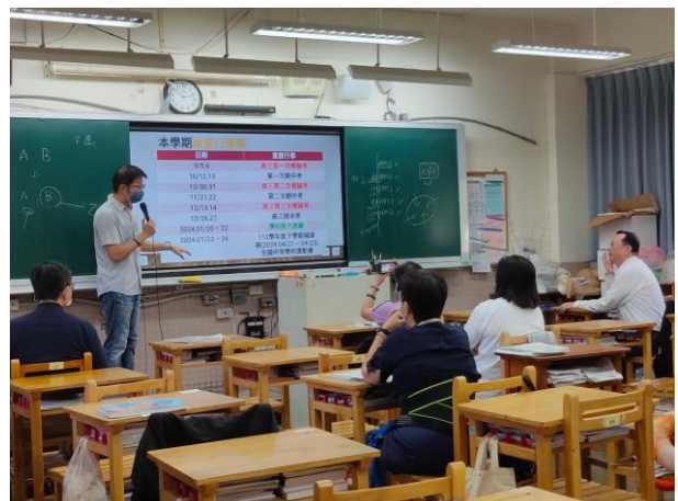
高中部導師向家長介紹說明