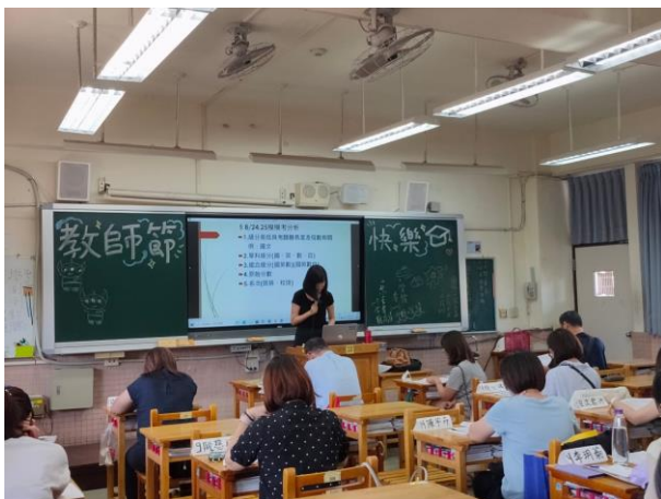
高中部導師向家長介紹說明