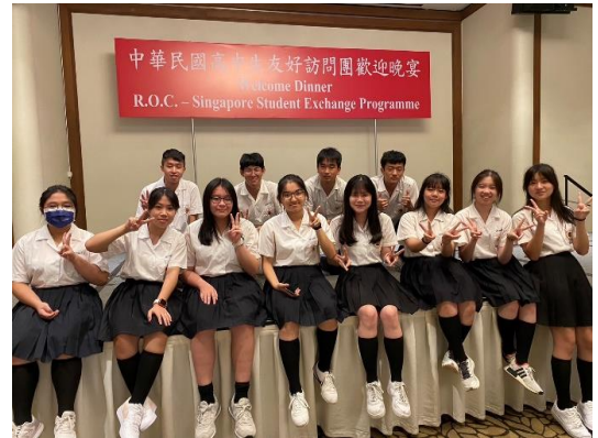
新加坡歡迎晚宴會後成淵學子合照