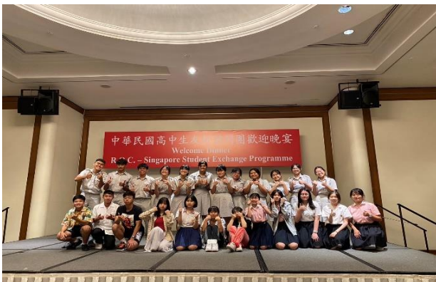
與新加坡交流學校-國家初級學院學生合照