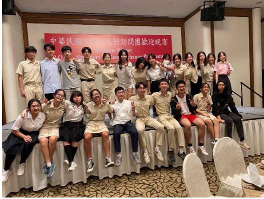
與新加坡交留學校-華僑中學學伴大合照