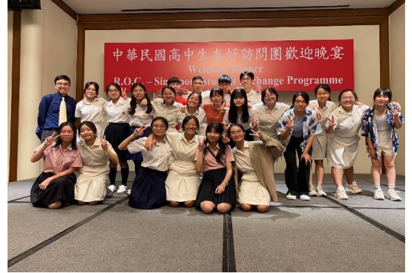
與新加坡交留學校-維多利亞初級學院學伴大合照