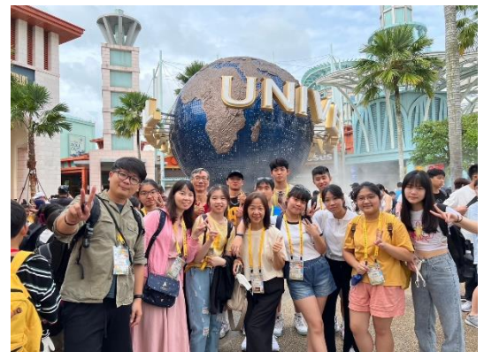
環球影城之旅-與學伴相見歡