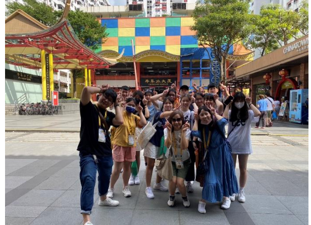
新加坡多元文化之旅-阿拉伯街、小印度、牛車水