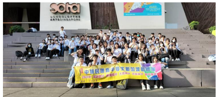
臺北市五校高中生新加坡交流全體師生大合照