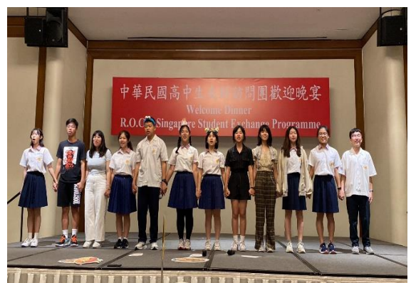
臺北市立大同高中表演