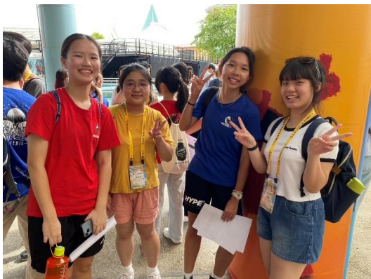
環球影城之旅-與學伴相見歡