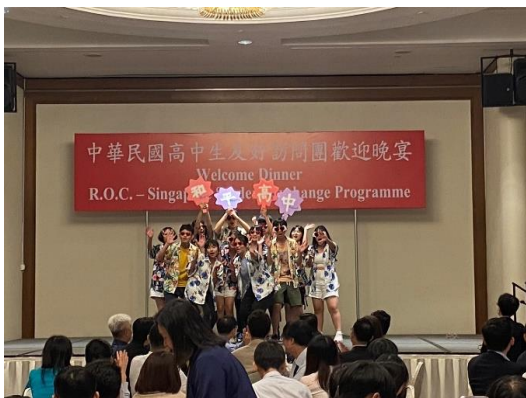
臺北市立和平高中表演