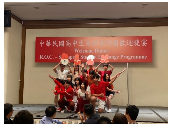
臺北市立百齡高中表演