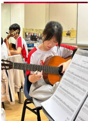
入校學習-萊佛士初級學院