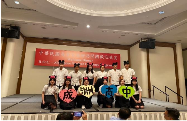
新加坡歡迎晚宴成淵高中學生表演

主題：臺北市五校高中新加坡交流 時間：112年07月13日(四)-22日(六) 地點：新加坡