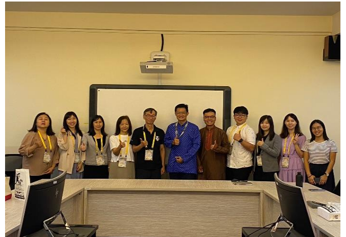
督學、校長與各校師長入校訪問