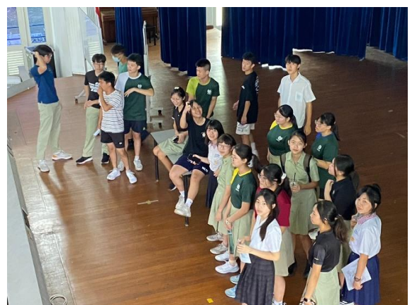
入校學習-淡馬錫初級學院