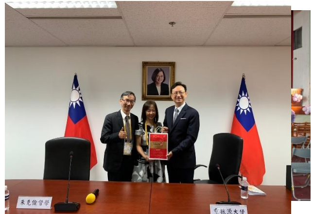
感謝新加坡教育部與新加坡駐台北辦事處